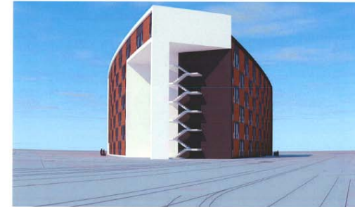
HJORTHAGEN KV V4 VOLYMSTUDIER 2008-11-25