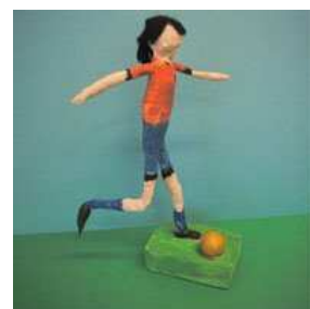
Elevarbete i bild

Kommentar: Vi är mycket nöjda med arbetsättet och delresultatet visar att vi valt rätt väg att gå.