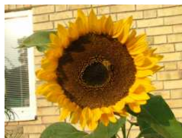
Solros från skolträdgården

Vi har 100 elever inskrivna i fritidsverksamheten. Vi har även 35 elever i öppen fritidsverksamhet för åk 4-6. Sedan vårterminen 2009 bedrivs fritidshemmets verksamhet i nyrenoverade lokaler i skolan. Det har gjort att vi fått en mycket mer strukturerad verksamhet med barn och personal samlade på samma plats.