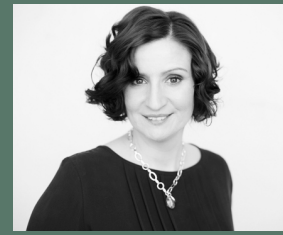
Under beskyddarskap av: Birgitta Ohlsson, EU-Minister

EUP har i många år arbetat med ungdomar runtom i Europa och involverar årligen cirka 20 000 europeiska ungdomar. Målet med den nationella sessionen är att engagera svenska gymnasieelever i aktuella frågor som berör Europa idag, under en tre dagar lång session i Stockholm.