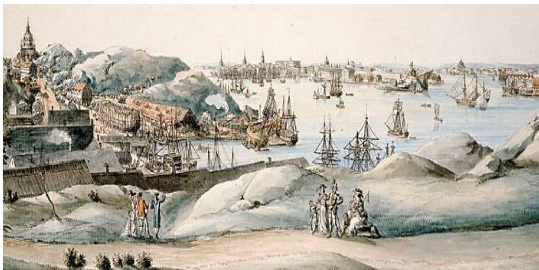
Tegelvikshamnen/Masthamnen år 1800

Hamnverksamhet har bedrivits i området i många 100 år tillbaka i tiden. Förändringar av verksamheten, små som stora, i en hamn pågår ständigt och är en del av det dagliga arbetet.