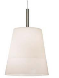
Taklampa Basisk, IKEA

Möbleringen är gjord så att delar av det befintliga möblemanget i Hus C kan återanvändas och flyttas hit