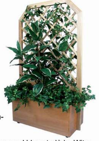
Spaljévagn med blomsterlåda, Witre