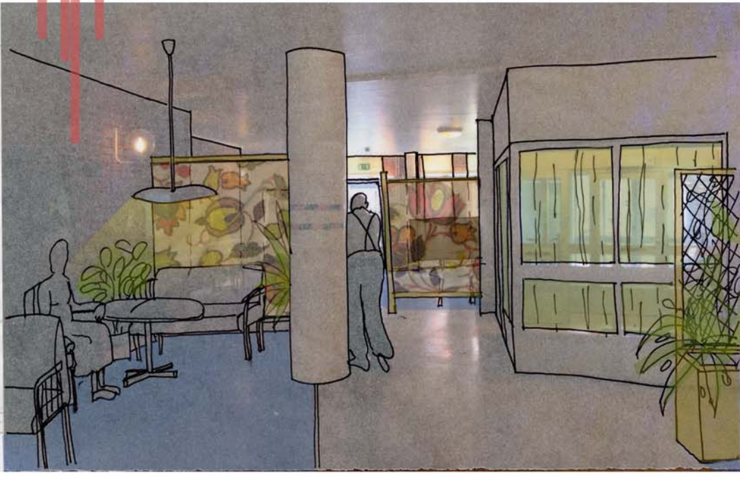
Perspektiv kommandes från Hus A