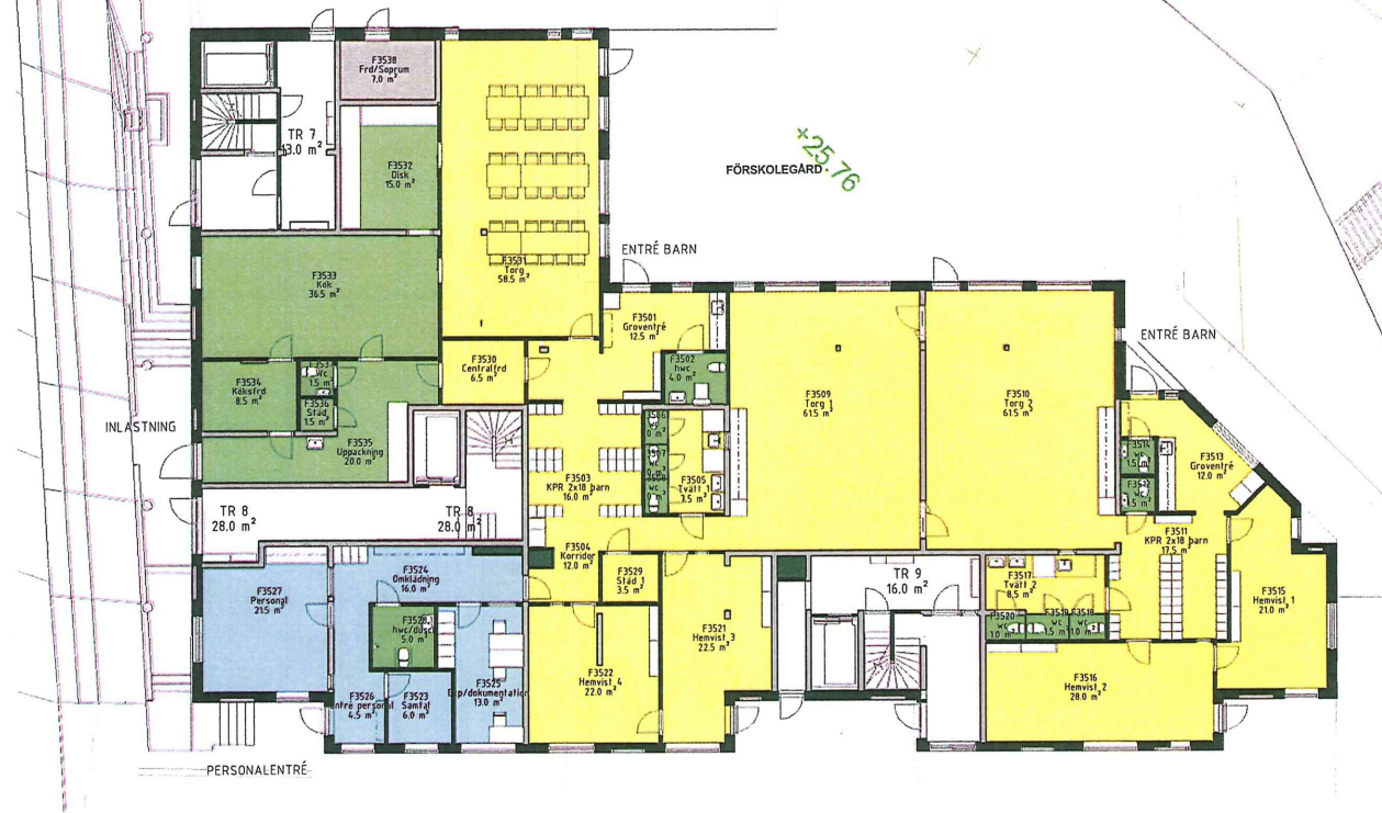
FÖRSKOLA HUVUDPLAN 573 m 2