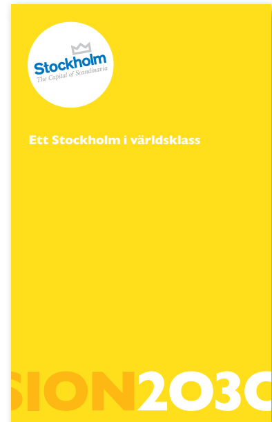
Vision 2030 , Stockholms stads visionsdokument.

En hållbar tillväxt och utveckling mot ett Stockholm i världsklass bygger på helhetsperspektiv och att de strategiska beslut som fattas av kommunfullmäktige, stadens nämnder och bolagsstyrelser inte går i olika riktningar. Översiktsplanen måste därför samordnas med den övriga styrningen och uppföljningen inom staden och ge ett allsidigt underlag för kommunfullmäktiges prioriteringar i ett kortare perspektiv (se vidare kapitel 4).