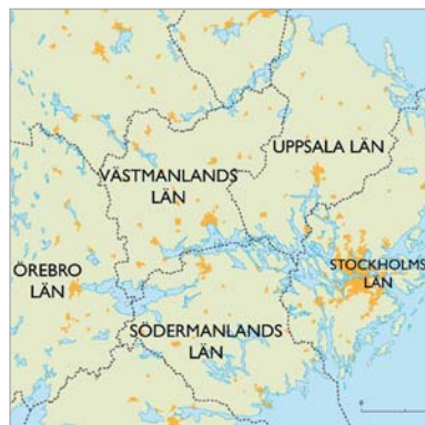
Stockholm-Mälardalenregionen definieras som Stockholms, Uppsala, Södermanlands, Västmanlands och Örebro län. Här bor cirka en tredjedel av landets befolkning.

Publicerades av stadsledningskontoret våren 2007.