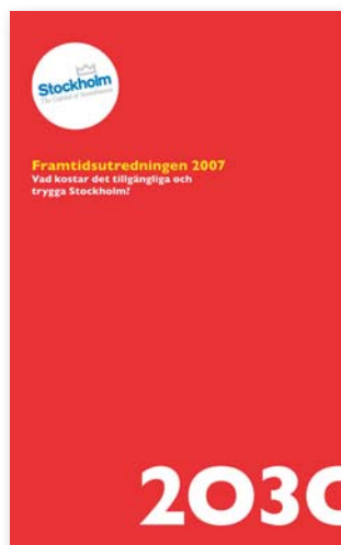
Framtidsutredningen 2007 visar på Stockholms stads ekonomiska framtidsutsikter.

Publicerades av stadsledningskontoret våren 2007.