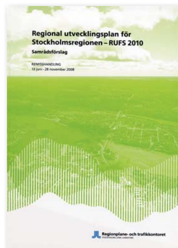
RUF 2010 är den nya regionala utvecklingsplanen.

En nationell strategi för hållbar utveckling presenterades av regeringen 2002 och reviderades och vidareutvecklades 2004 och 2006. Strategin omfattar alla dimensioner av hållbar utveckling: miljömässiga, sociala – inklusive kulturella – och ekonomiska. En mängd indikatorer, varav tolv huvudindikatorer, har valts ut för att mäta om arbetet för en hållbar utveckling går åt rätt håll.