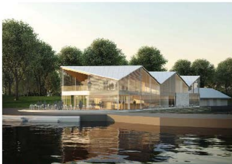
Perspektiv från sydost (DAPstockholm/Waldemarsson Berglund)