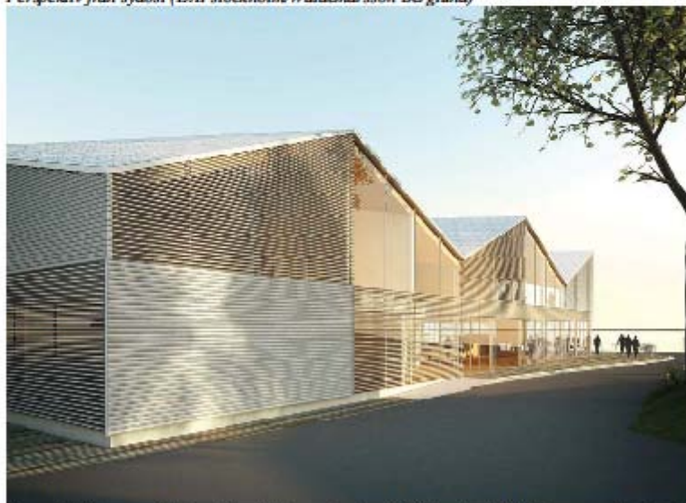
Perspektiv från nordväst, entré och vägen mot piren (DAPstockholm/Waldemarsson Berglund)