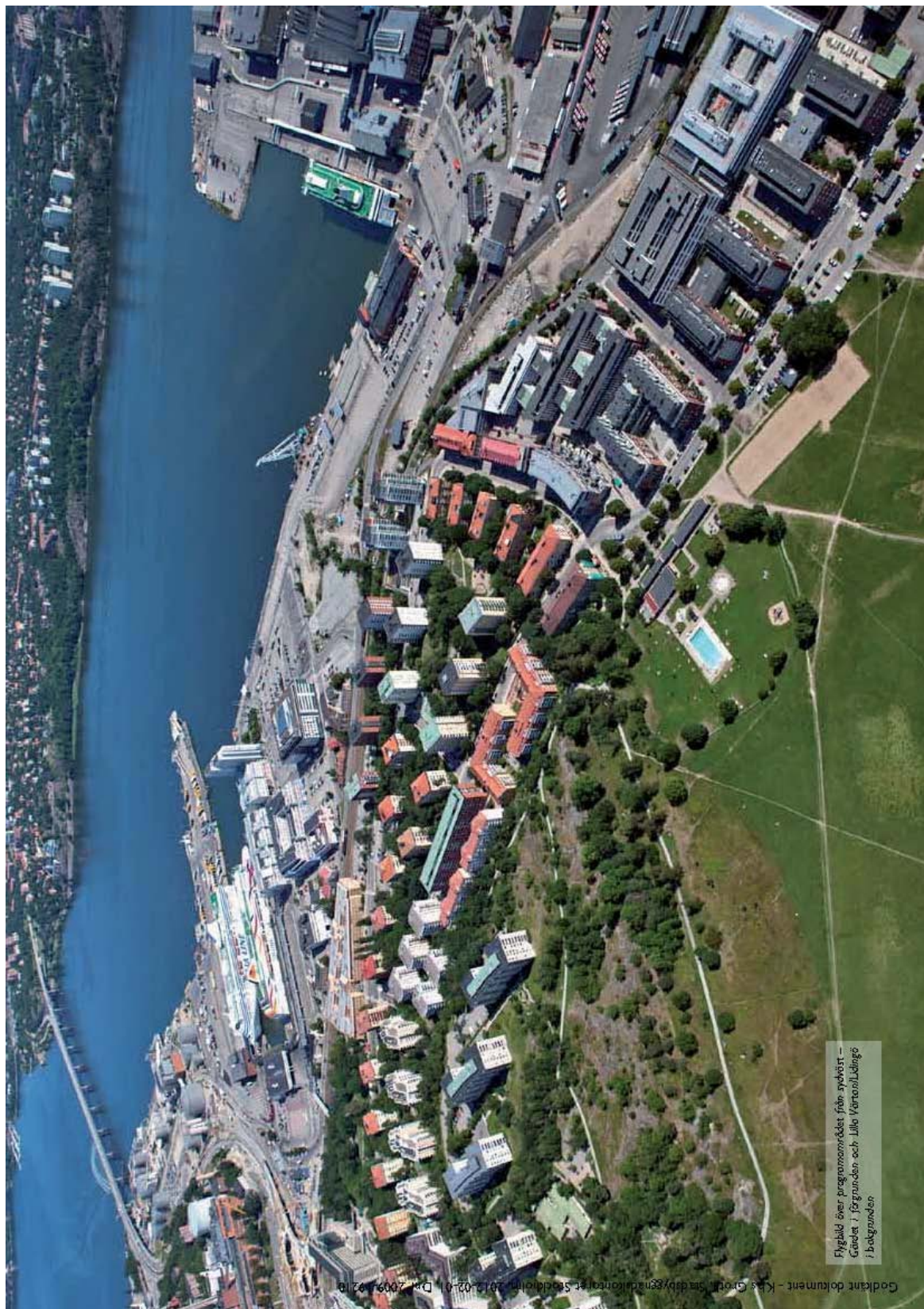
Flygbild över programområdets från sydväst – Gäddet i förgrunden och Lilla Värtan/Långe i bakgrunden.

Godkänt dokument - K&S Grov, stadsbyggnadskonferens, Stockholm, 2012-02-01, Dnr 2009/0210