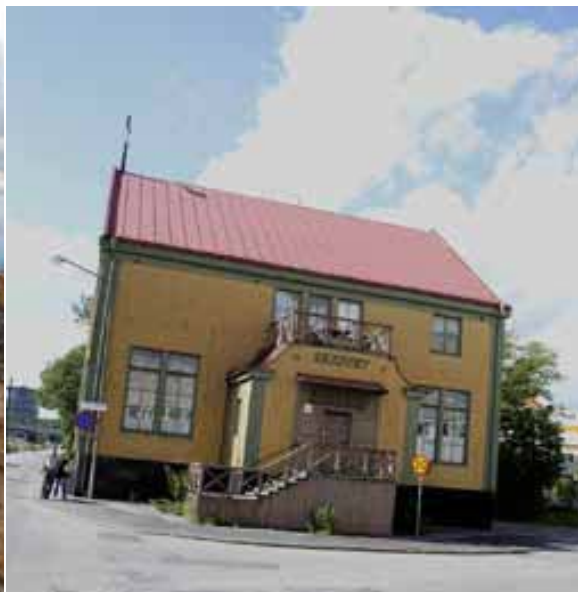
F d restaurang Skeppet