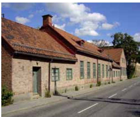
Smedjan (kv Bristol).