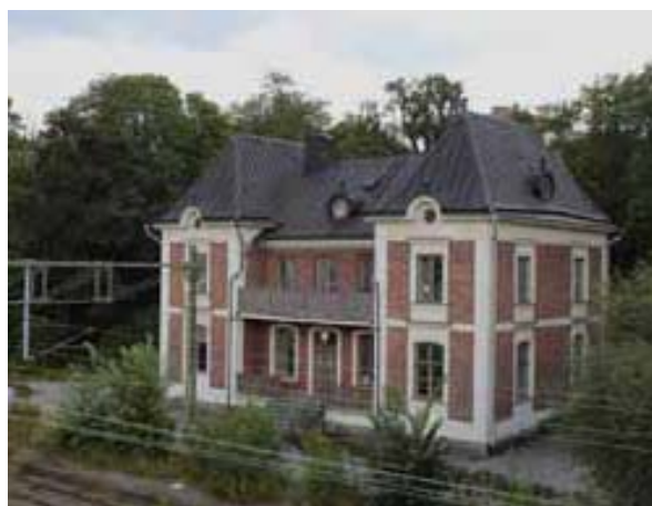
Värtahamnen f d stationshus, byggnadsminne