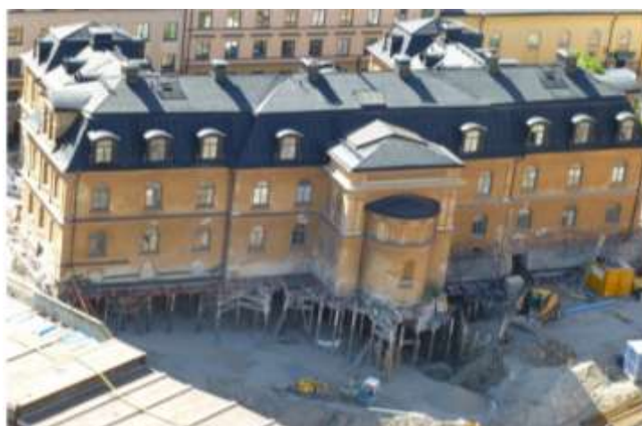
Bild 4: Byggnaden hålls uppe med hjälp av pålar i samband med byggnationen av Citybanan.