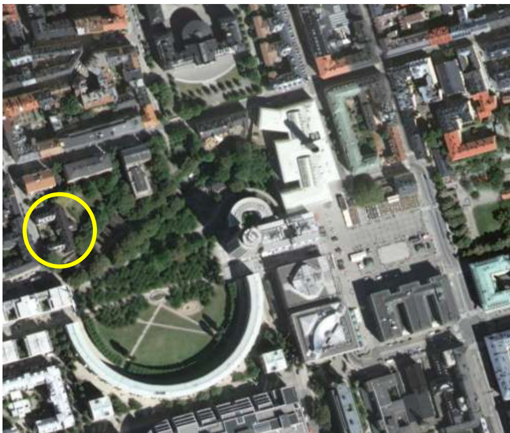
Bild 1: Fastigheten Stiftelsen 1 (inringad) vid Fatbursparken och Medborgarplatsen på Södermalm

Fastighetskontoret äger fastigheten Stiftelsen 1, belägen på Björngårdsgatan 23-25 vid Fatbursparken på Södermalm. På fastigheten finns en byggnad kallad "Oscar den I:s minne" om 1 945 m 2 bruksarea, ritad av arkitekt Per Ulrik Stenhammar. Sedan år 2009 är den uthyrd i sin helhet till trafikverket i och med byggnationen av Citybanan, som ska passera under byggnaden i en tunnel.