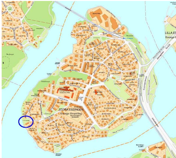
Aluddsparkens läge på Stora Essingen