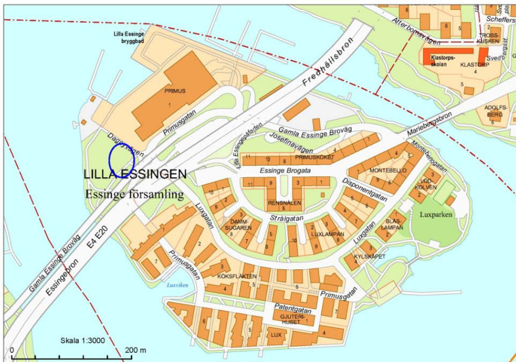
Stadsodlingens föreslagna läge på Lilla Essingen

I augusti 2012 inkom en förfrågan om att starta upp stadsodling på Lilla Essingen. Förvaltningen uppmanade då de odlingsintresserade att bilda en förening och återkomma med förslag på plats. I början av oktober träffade förvaltningen den nybildade föreningens talesperson och tittade på en föreslagen plats i Västra Primusparken på lilla Essingen.