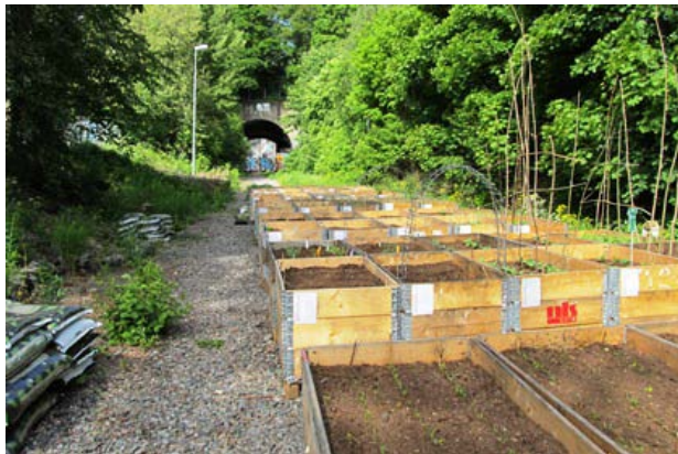
Stadsodling "På spåret", Södermalm. Odling i s.k. pallkragar

Förvaltningen anser vidare att principen att endast tillåta stadsodling på underutnyttjad parkmark och på mark som väntar på exploatering eller annan typ av förnyelse bör gälla även vid framtida förfrågningar.