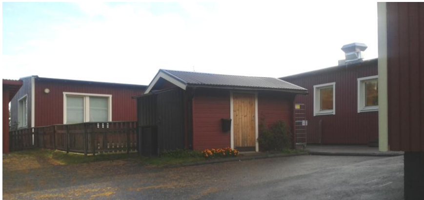
Befintlig bebyggelse sedd från nordväst.

Geotekniska förhållanden Jordarterna i området består till största delen av urberg (rött i karta) i den västra delen, samt en liten del morän (ljusblått) i fastighetens östra hörn. Grundförhållandena bedöms som goda.