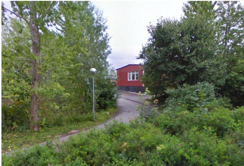
Befintlig bebyggelse, sedd från gångvägen.

Fastigheten är bebyggd med en 735 kvm stor förskolebyggnad i en våning med tillhörande förrådsbyggnader. Byggnaden är från tidigt 1970-tal och klädd i röd träpanel. På förskolegården finns förråd och ett s.k. miljöhus för avfallshantering.