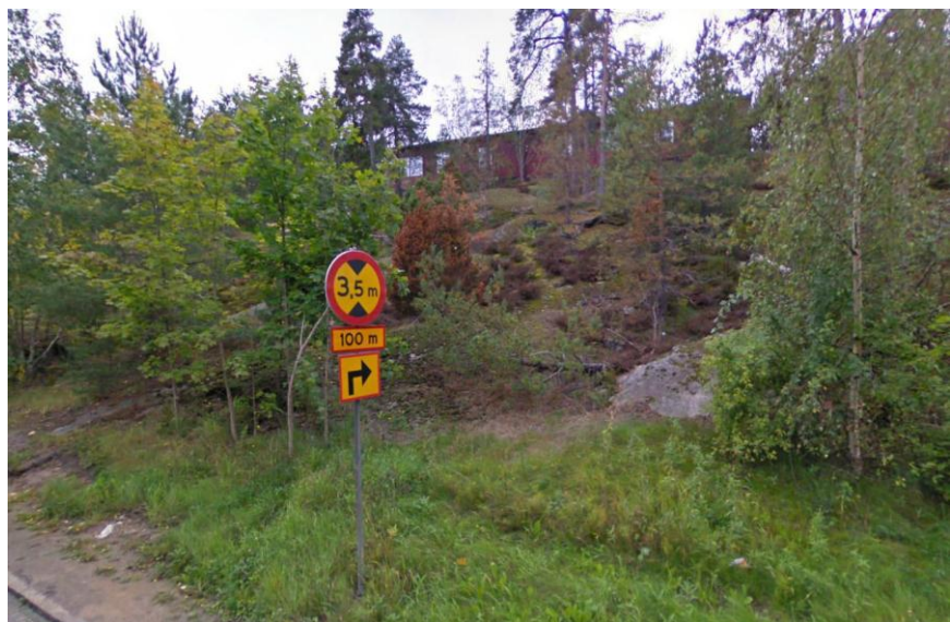
Slänten mellan Tärningen och Granängsvägen

Omkringliggande bebyggelse består i huvudsak av flerbostadshus i 5–8 plan, samt kommunens reservvärmeverk och Nyboda skola.