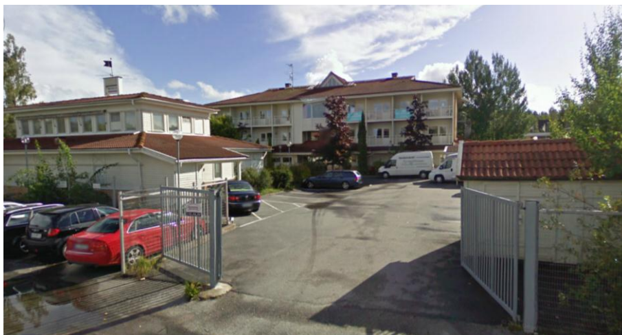
Fastigheten sedd från nordväst.