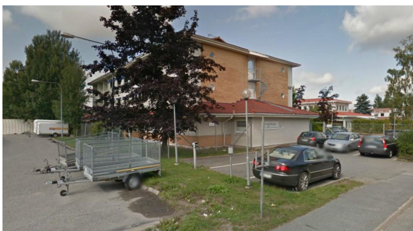
Fastigheten sedd från sydöst.

Geotekniska förhållanden Jordarterna inom och runt planområdet består av postglacial sand (rosa i karta).