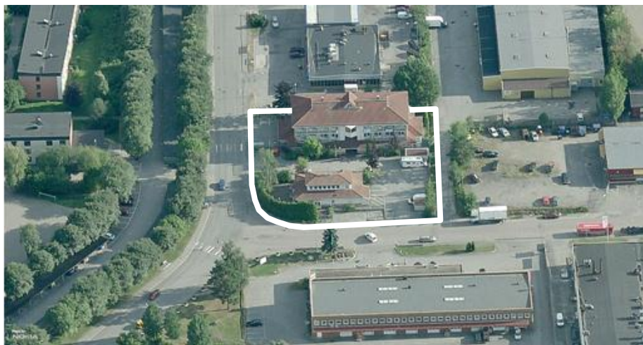
Flygbild över planområdet sett från norr

Planområdet ligger i korsningen Björkbacksvägen/ Vintervägen i Bollmora industriområde. Fastigheten gränsar i dagsläget till en bensinstation i söder och till en hyrbilsverksamhet med parkering i väster.