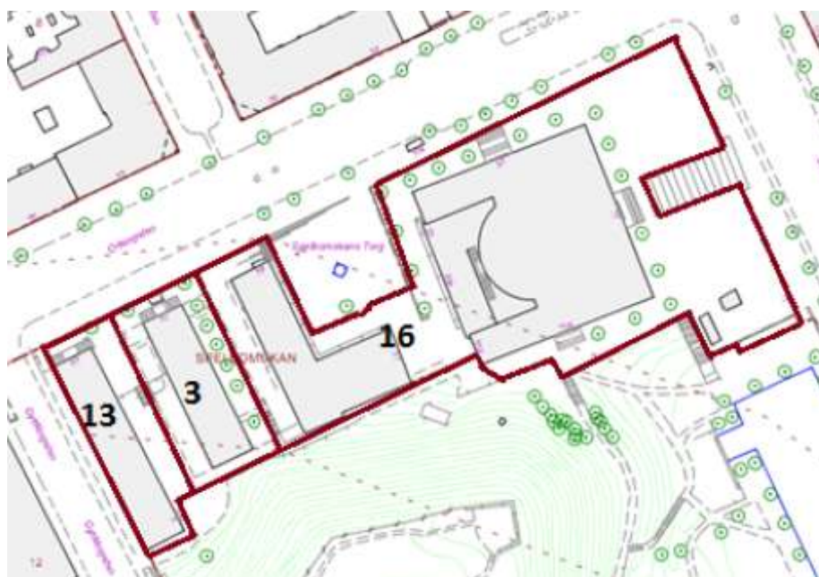
Figur 3 Kvartersnummer för Spelbomskan

Spelbomskan 3 och 13, Lamellhusen: Arkitekt: Erik Lallerstedt (bl.a. känd som huvudarkitekt för KTH) Byggherre: Stockholms Högskola Byggnadsår: 1929-1930 Historisk klassificering: blå Byggdes som skolbyggnad.