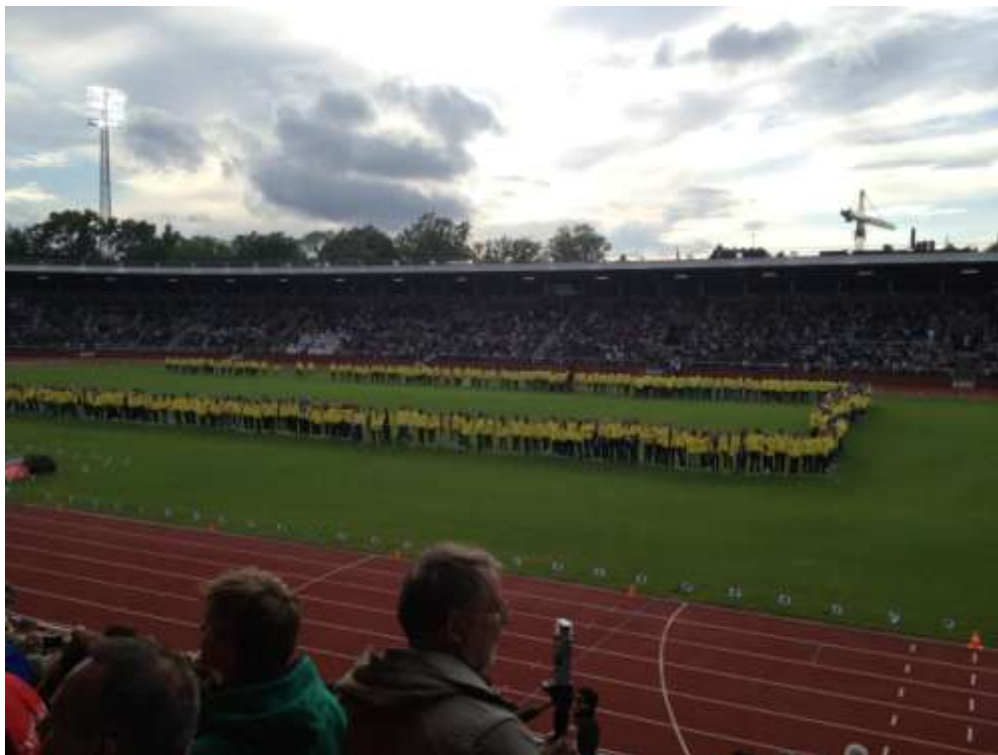
Figur 4 Mast med ny arenabelysning syns i övre vänstra hörnet. Idrottande ungdomar står på planen vid Stadions 100-årsfest.