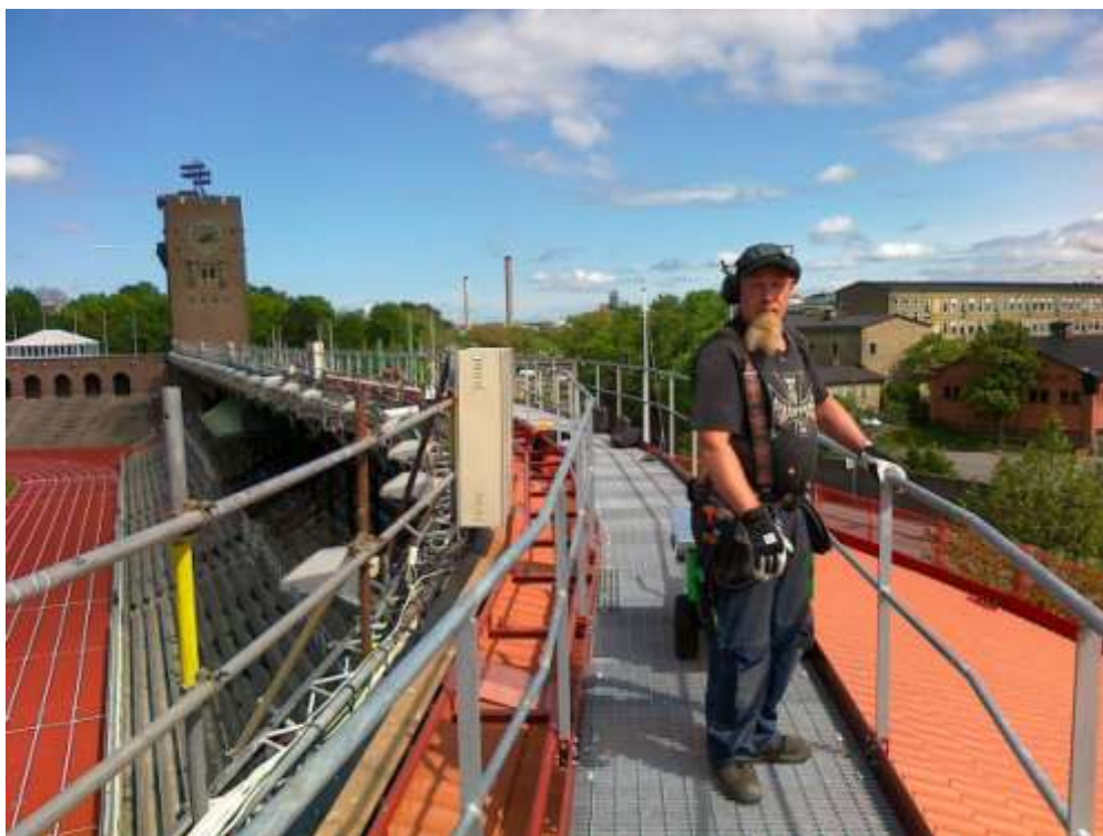
Figur 2 Läktartak, takbrygga och hantverkare.