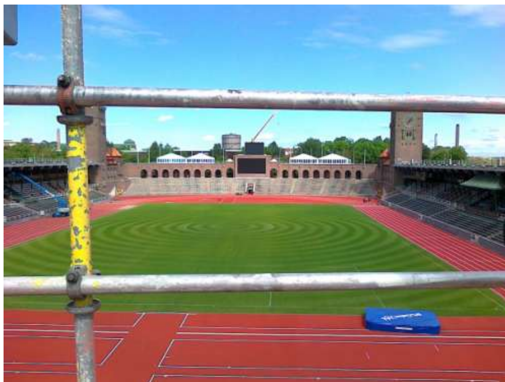
Figur 1 Stockholms stadion. Vy mot norra läktaren och nya resultattavlan.

Stockholms Stadion, inklusive markområdena på området, är klassad som byggnadsminne, varför det ska utformas likt originalutförandet. Undantaget är den norra läktaren som byggdes 1996.