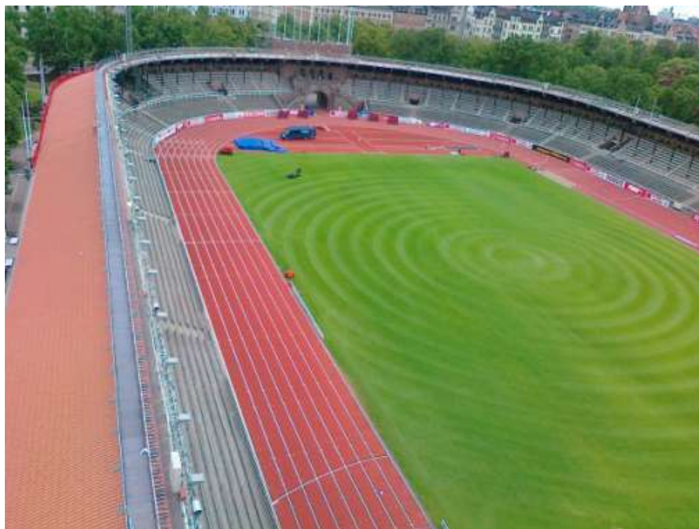
Figur 5 Vy från Klocktornet i riktning mot Valhallavägen och flaggbalkongen.

I det nybyggda teknikrummet har ytor hyrts ut till teleoperatörer.