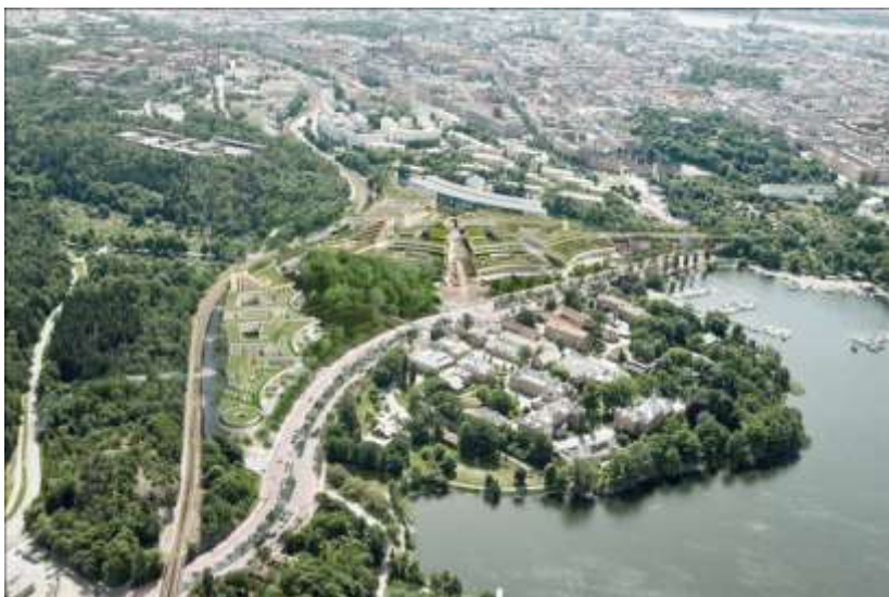
Fotomontage över Albano, vy mot söder