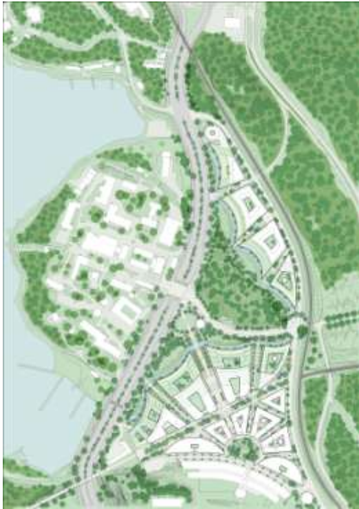
Situationsplan över Albanoområdet