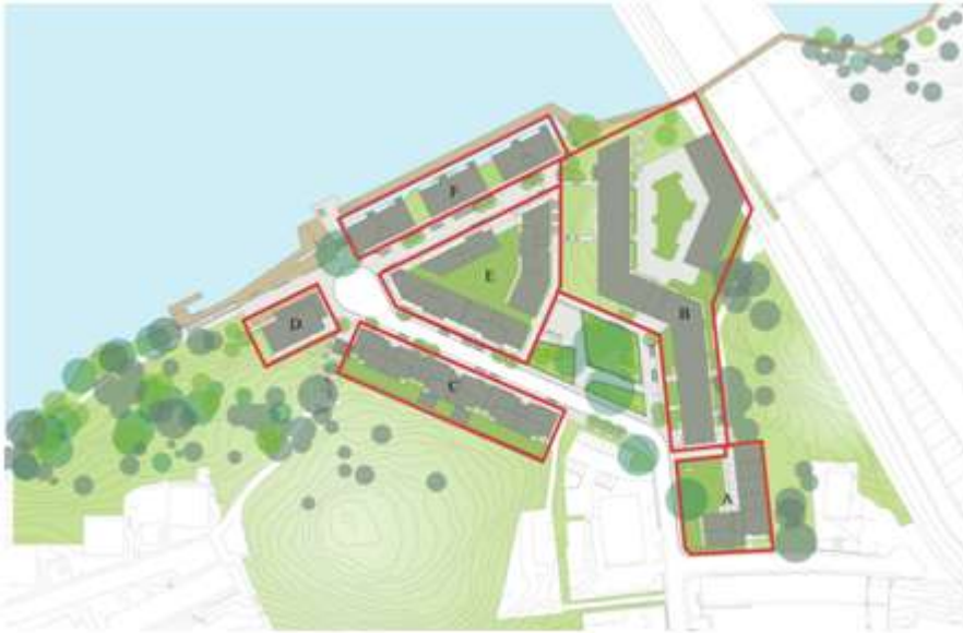
Situationsplan: Föreslagen ny bebyggelse i grått.

Förslaget innebär att kontors-, industri- och ett klubbhus för en kanotklubb rivs och ersätts med i huvudsak bostäder, sammanlagt ca 320 lgh med både bostadsrätter och hyresrätter, men även två daghem, lokaler för verksamheter och nya lokaler för kanotklubben. Vid Gröndalsvägen planeras en parkeringsanläggning med ca 70 platser. Det nya bostadsområdet har sin entré i söder längs Bryggvägen och sträcker sig norrut mot Mälaren. Bebyggelsen följer i stort terrängförhållandena med högre bebyggelse i söder som sedan trappar ner i höjd mot vattnet med undantag för ett högre hus i väster.