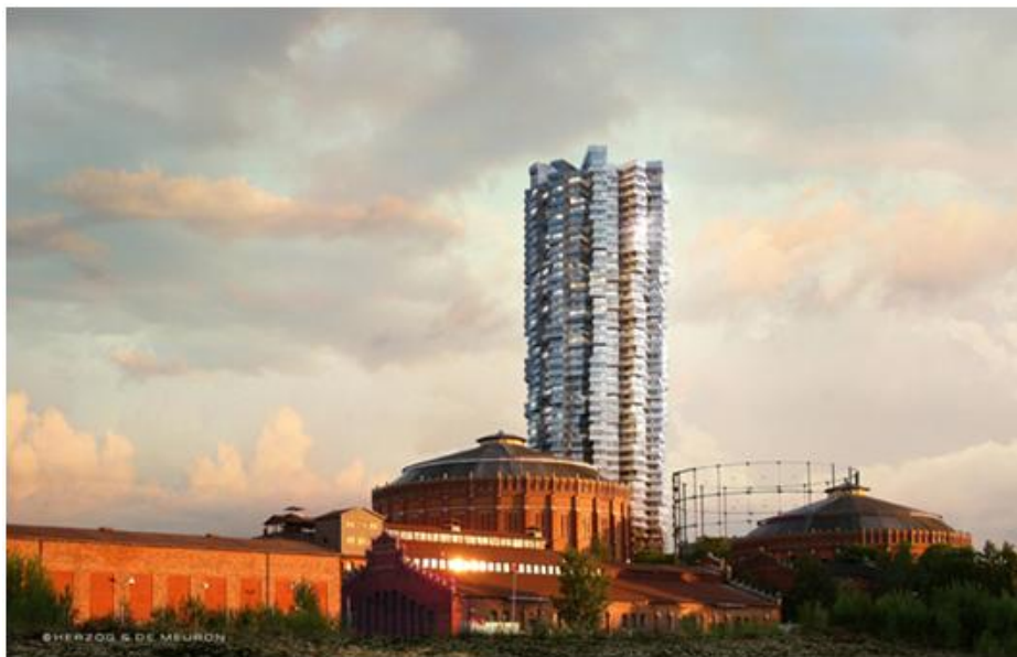
Gasklocka 4, förslag i samrådsremiss för detaljplan 2011.

I Norra Djurgårdsstaden planeras för närvarande ett 170 m högt hus vid Gasverksområdet, Gasklocka 4. Ny teknik och smarta lösningar kommer att behöva prövas för att klara de uppställda miljökraven för projektet.