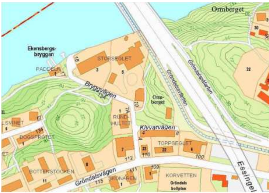
Kartbild över området.