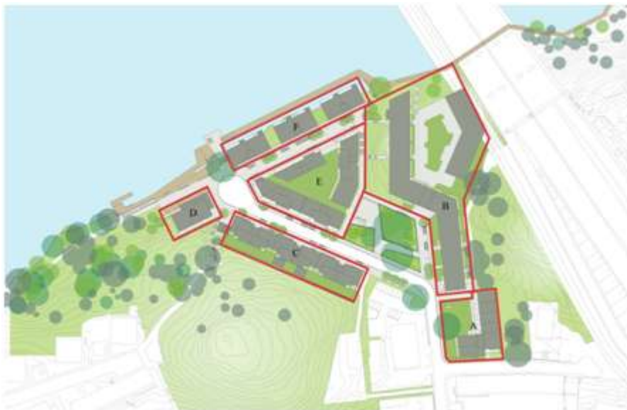
Situationsplan: Föreslagen ny bebyggelse i grått.

Förslaget innebär att kontors-, industri- och ett klubbhus för en kanotklubb rivs och ersätts med i huvudsak bostäder, sammanlagt ca 320 lgh med både bostadsrätter och hyresrätter, men även två daghem, lokaler för verksamheter och nya lokaler för kanotklubben. Vid Gröndalsvägen planeras en parkeringsanläggning med ca 70 platser. Det nya bostadsområdet har sin entré i söder längs Bryggvägen och sträcker sig norrut mot Mälaren. Bebyggelsen följer i stort terrängförhållandena med högre bebyggelse i söder som sedan trappar ner i höjd mot vattnet med undantag för ett högre hus i väster.