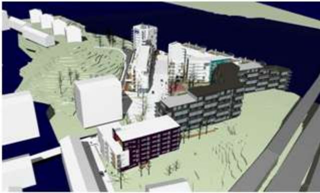
Illustration, vy från sydost.