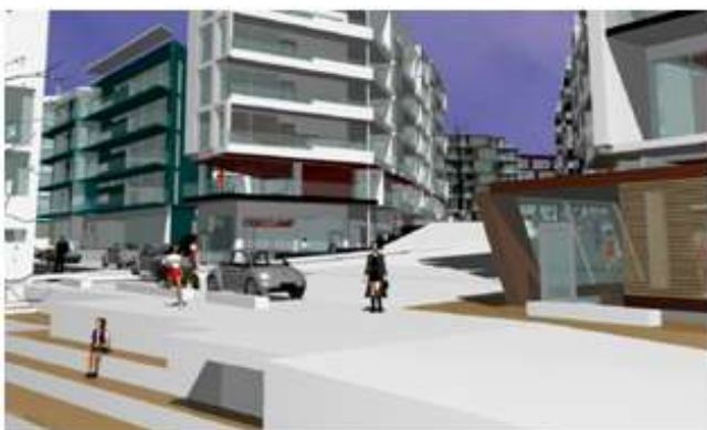
Illustration, vy från torget vid vattnet.