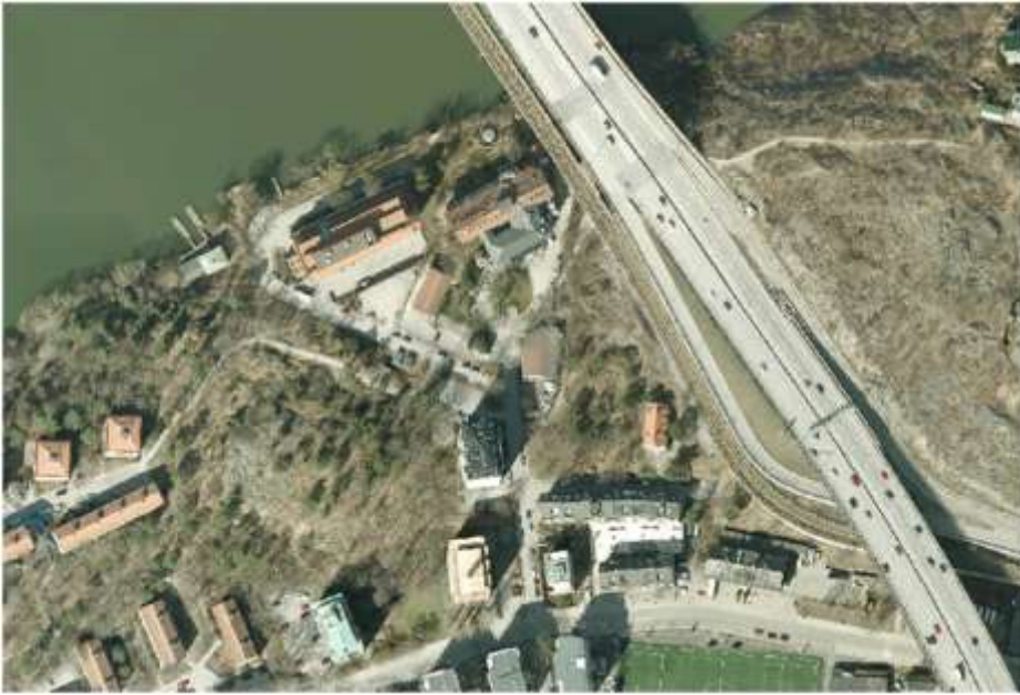
Flygfoto: Området idag.