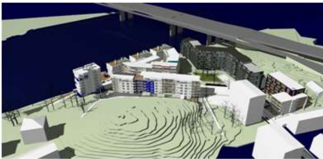
Illustration, vy från sydväst.