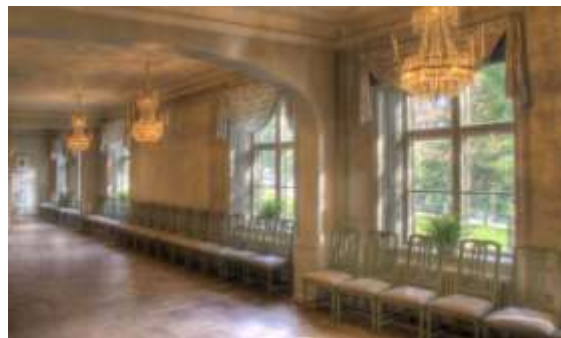
Kristinasalen i Kristinehavs Malmgård

Underhåll och upprustning är en viktig fråga för de lokalförvaltande organisationerna att ta upp med sina hyresvärdar. Den berör i förlängningen också stödbehoven i de fall upprustning föranleder hyresökningar. I det nuvarande stödsystemet finns inga särskilt anvisade medel för investeringar och löpande underhåll förutsätts omfattas av grundbidraget. Större investeringar ska normalt bekostas av hyresvärderna och finansieras genom hyran. I valet mellan oförändrad hyra och kostsamma hyreshöjande investeringar väljer de flesta lokalförvaltande organisationerna att avstå från behövliga lokalförbättringar vilket medfört att flertalet lokaler är i behov av upprustning. I flera fall har man också ingått avtal med fastighetsägaren om att ta över ansvaret för det inre underhållet vilket särskilt för kulturhistoriskt känsliga lokaler kan innebära en tung ekonomisk börda.