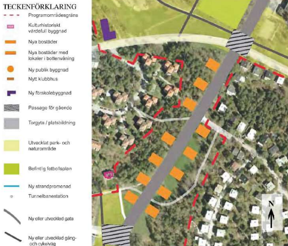
Utbyggnadsetapp 2 – Blackebergsvägen. Från Stadsbyggnadsstrategi, Stadsbyggnadskontoret 2013-03-14.