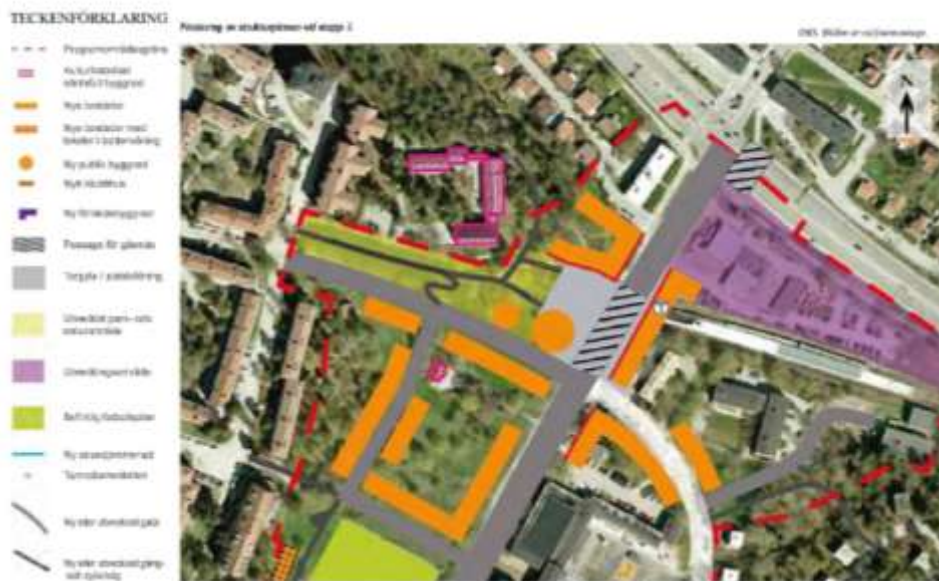
Utbyggnadsetapp 1 – Nya Islandstorget. Från Stadsbyggnadsstrategi, Stadsbyggnadskontoret 2013-03-14.