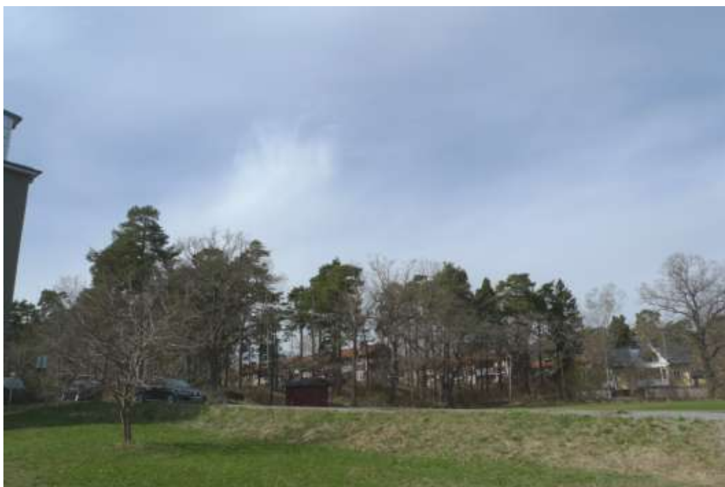
Läge för etapp 3, Blackebergsbackens östra del. Ljunglöfska tjänstebostaden ses till höger i bild. Foto SSM maj 2013.