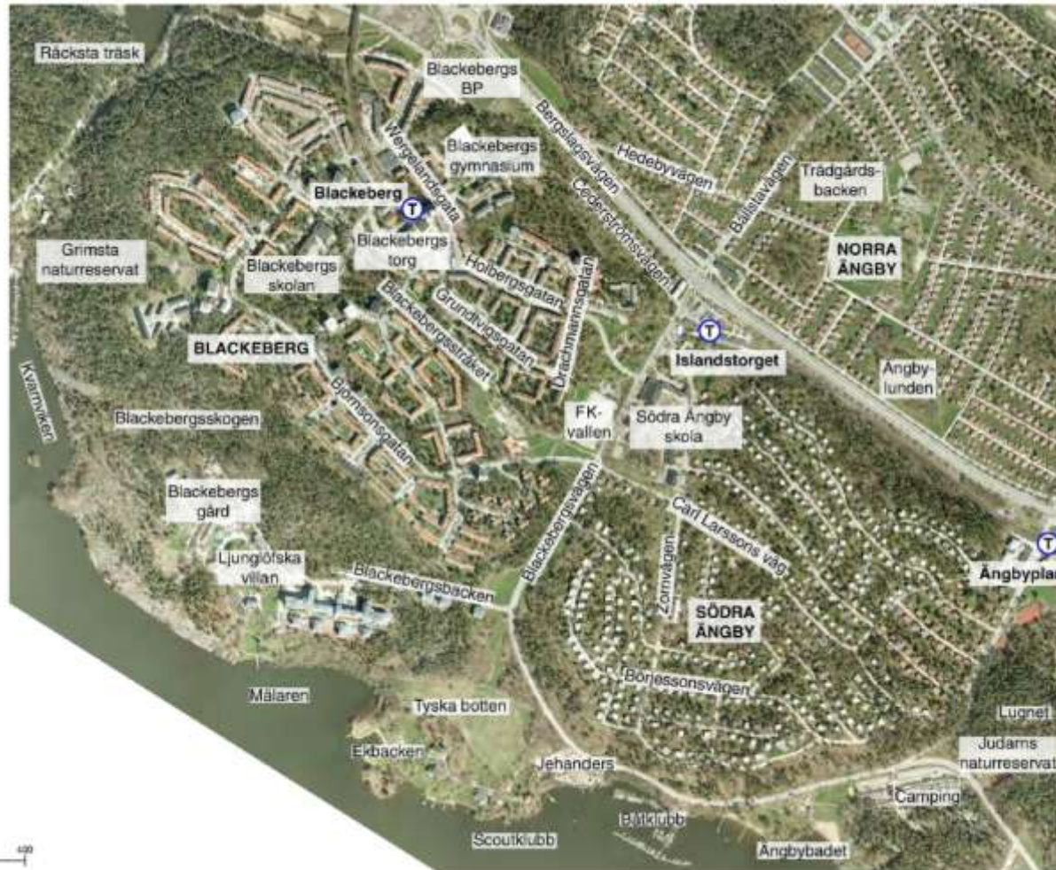
Översiktskarta över Blackeberg, Södra Ängby och Norra Ängby