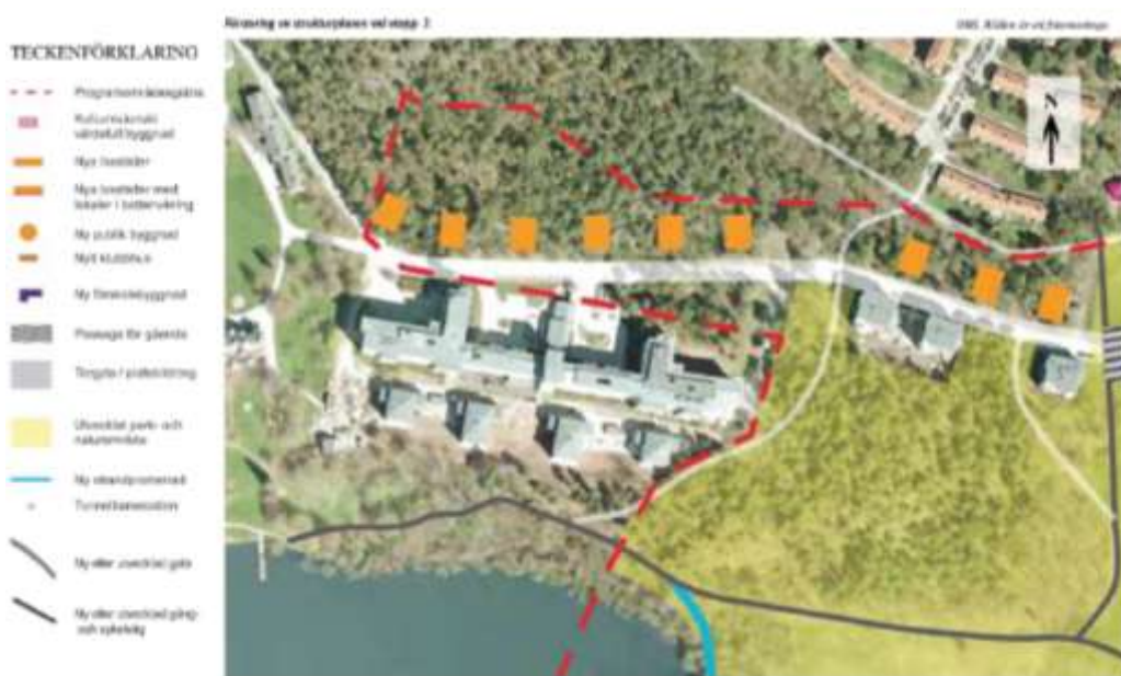
Utbyggnadsetapp 3 – Blackebergsbacken. Från Stadsbyggnadsstrategi, Stadsbyggnadskontoret 2013-03-14.