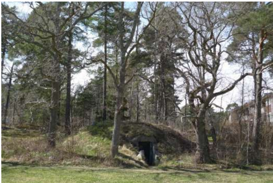
Läge för etapp 3. Jordkällare och ekbacke vid Blackebergsbackens östligaste del. Foto SSM maj 2013.