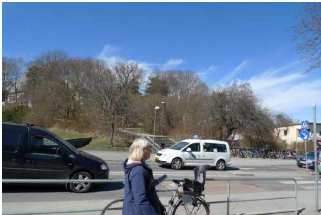
Vy mot väster med Ängby kyrka och framförliggande park. Blackebergsvägen i förgrunden. Läge för etapp 1, föreslagen nybyggelse vid kyrkan. Foto SSM maj 2013.