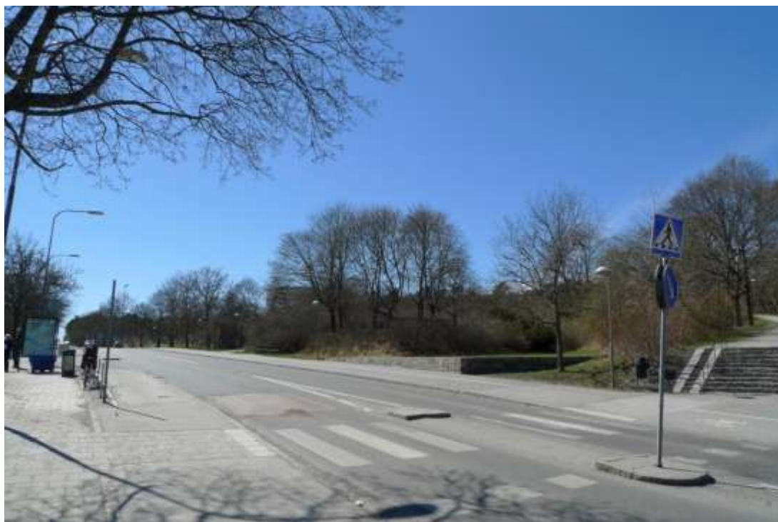
Vy från Islandstorget och Blackebergsvägen söderut. Till höger i bild ses trappa som leder till parkrummet kring kyrkan. Läge för etapp 1, ny torgbildning. Foto SSM maj 2013.