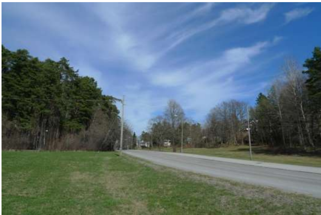
Vy Blackebergsvägen mot norr. Läge för etapp 2, bebyggelse om båda sidor av vägen. Foto SSM maj 2013.