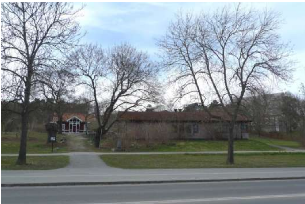
Vy mot väster med Lilla Ängby gård. Kyrkan ses till höger i bild. Blackebergsvägen i förgrunden. Läge för etapp 1, föreslagen bebyggelse kring gården. Foto SSM maj 2013.