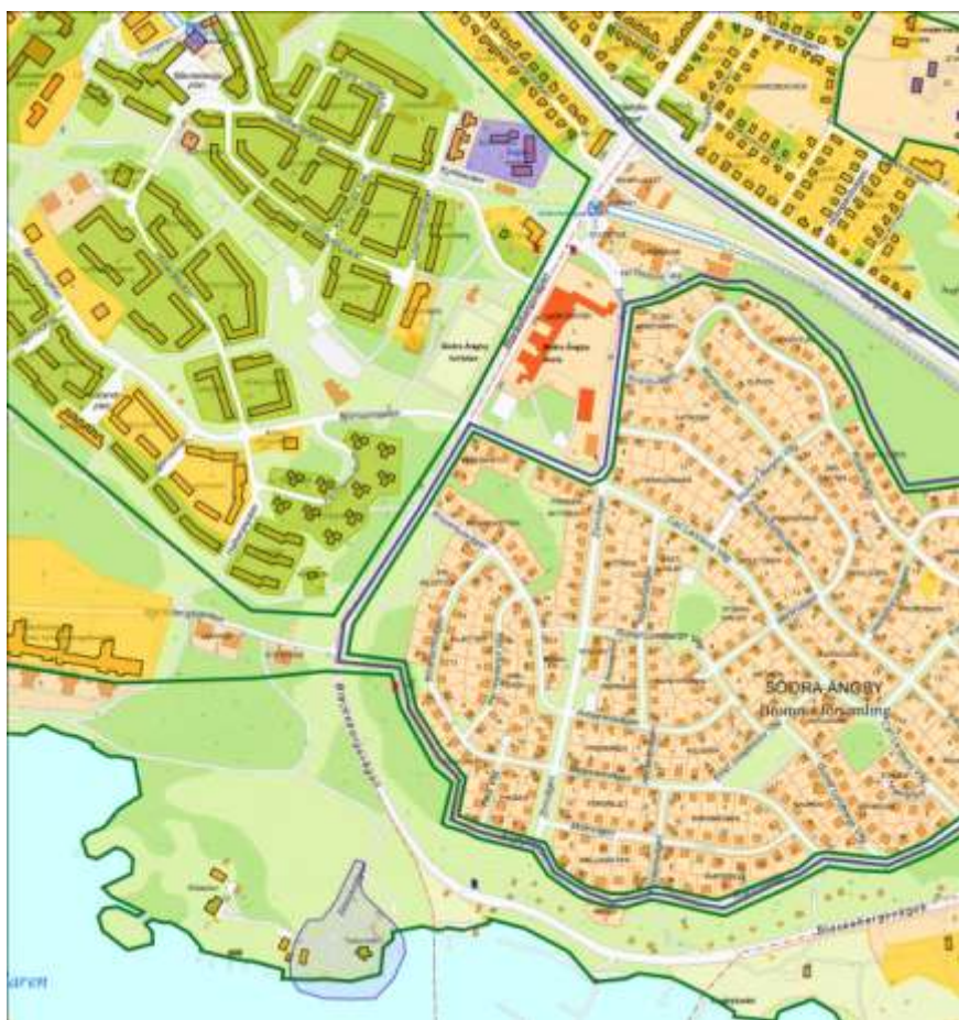
Stadsmuseets kulturhistoriska klassificeringskarta. Blå gränsdragning = riksintresset, grön gränsdragning = utpekad kulturhistorisk miljö. Registrerade fornlämningar syns som små R i rött eller blått samt blåmarkerat område för färjeläget Tyska Botten.