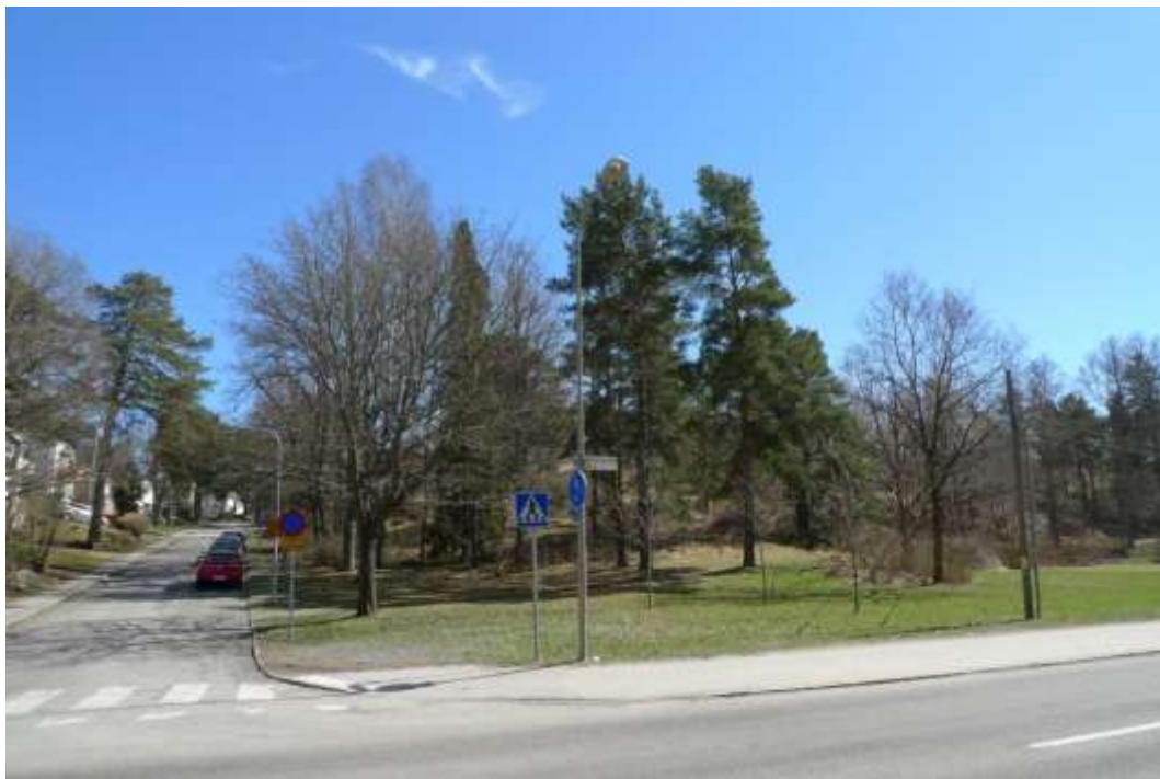
Vy mot sydost i hörnet Aroseniusvägen – Blackebergsvägen. Etapp 2, föreslaget läge för nordligaste huset utmed Blackebergsvägens östra sida. Foto SSM maj 2013.