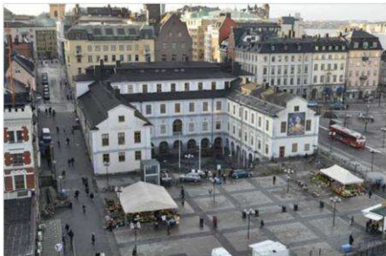
Södra stadshuset vid Ryssgården

Fastighetskontoret har i samarbete med kulturförvaltningen genomfört en sammanvägd bedömning av det framtida investeringsbehovet för Stadsbiblioteket, Stockholms stadsmuseum och Medborgarhuset kopplat till verksamheternas lokalbehov och byggnadernas tekniska status, vilket resulterade i ett reviderat utredningsbeslut i Fastighetsnämnden 2013-03-05 samt i Kulturnämnden 2013-03-11.