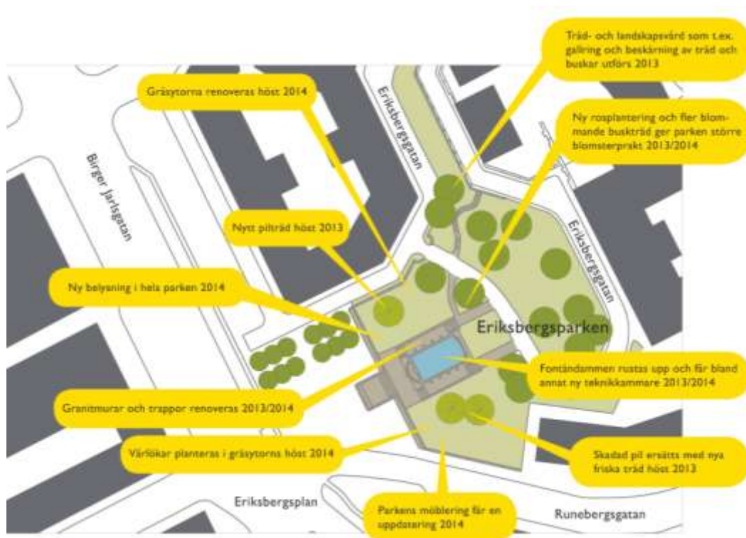
Illustration som visar parkupprustningens huvuddelar och tid för planerat genomförande.

Inför upprustningen genomfördes under 2012 en konditionsbedömning med åtgärdsförslag för parkens trappor och murar. Utredningen visade att de centrala trapporna måste läggas om helt och att trappan upp till Eriksbergsgatan måste fogas om tillsammans med samtliga av parkens murar. I samband med parkupprustningen kommer även trafikkontoret, som ansvarar för stadens prydnadsdammar och fontäner, att renovera parkens damm och det tillhörande teknikutrymmet som finns beläget innanför muren mot Runebergsgatan.