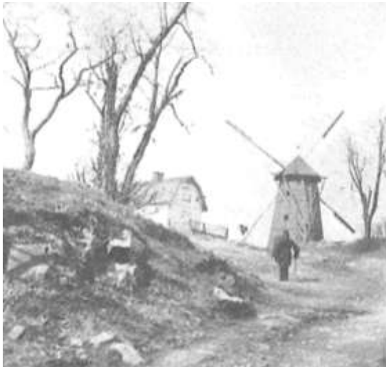
Där Timmermansordens byggnad ligger idag var tidigare en kal Slutning med en kvorn på höjden. Parkarbetena påbörjades 1915 och pågick i ett drygt tiotal år.

Området kring Eriksbergsplan och Eriksbergsparken har en 1700- och 1800-talshistoria som inte är så smickrande. Långt in på 1800-talet bestod platsen av ett slumområde. Ungefär där Eriksbergsplan ligger idag låg Träsktorget där offentliga bestraffningar utfärdades fram till 1857. Strax nordost om detta låg egendomen Eriksberg som ägdes av Timmermansorden. En vändning kom under 1900-talet när stadens parkavdelning började att röja den del som i dag är Eriksbergsparken. I början av 1920-talet byggdes också Timmermansordens pampiga byggnad, vilken idag är blåklassad av Riksantikvarieämbetet och därmed har högsta bevarandevärde.