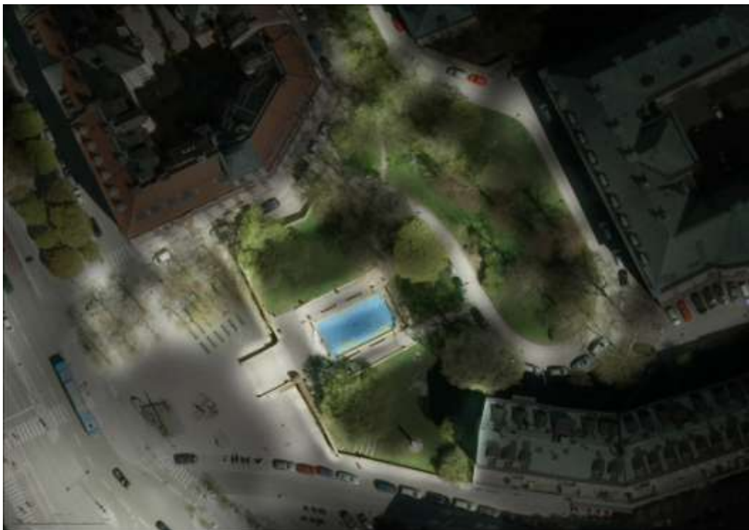
Illustration som visar hur Eriksbergsparken är tänkt att belysas. Den centrala delen blir ljusare tillsammans med Runebergsgatans nedre del och platsen vid lindarna på Eriksbergsplans.

Ett belysningsprogram tas fram under 2013 med syfte att ersätta parkens nuvarande stolparmaturer med färre stolpar och med armaturer som belyser murar, trappor och dammen. Syftet är att lyfta fram parkens arkitektur och göra den idag ganska mörka platsen ljusare och mer attraktiv samtidigt som tryggheten förstärks. Även Runebergsgatans nedre, idag ganska mörka del och Eriksbergsplans sittplats under träden ingår i belysningsprogrammet. Belysningsprogrammet tas fram i samarbete med trafikkontoret, som ansvarar för stadens offentliga belysning, och som sedan bekostar utförandet.