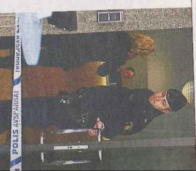
Kvinnan hittades död på hotell Birger Jarl.