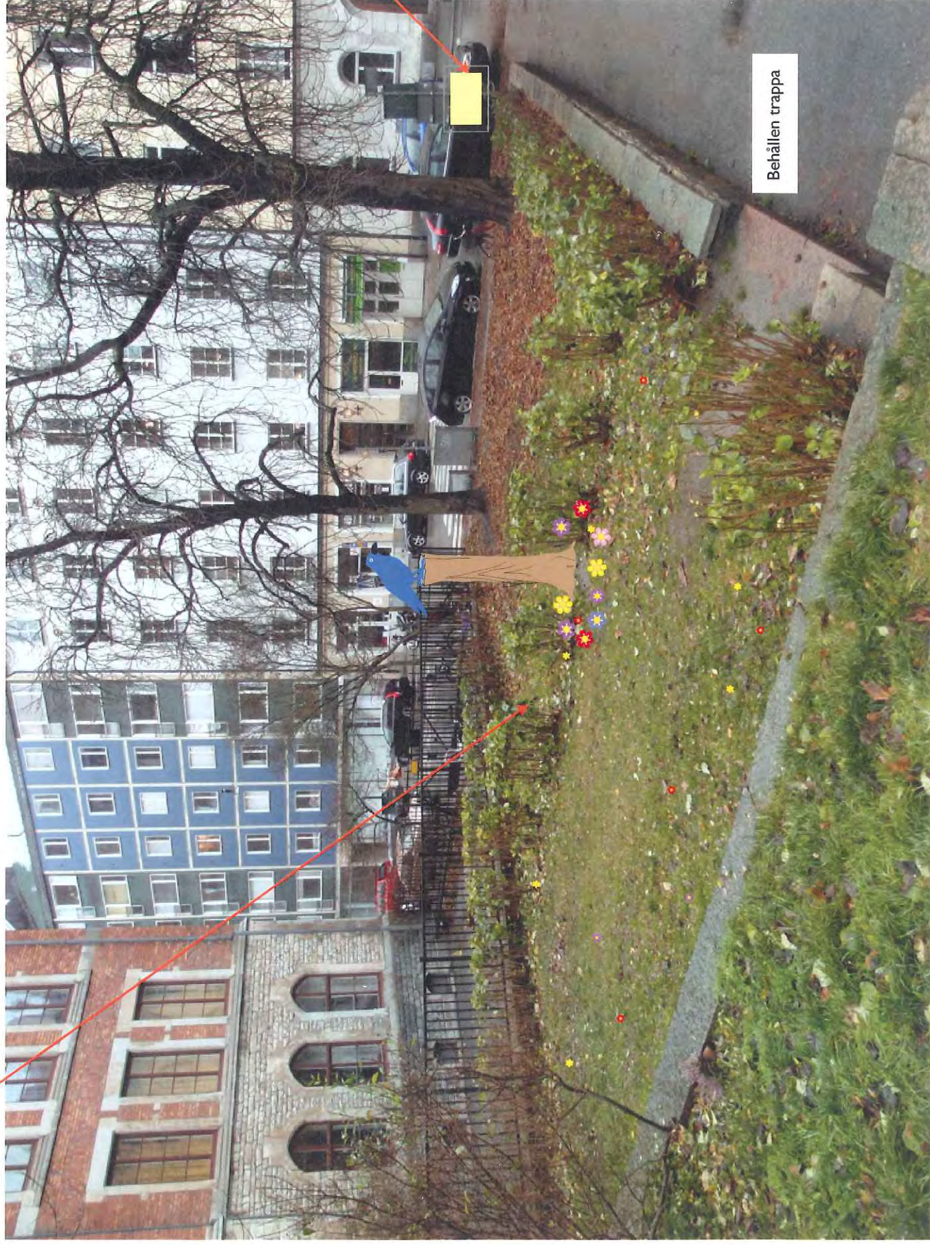
Bild 3. Ingen buskage som delar upp den lilla ytan. En skulptur av trä. Blommor sommartid, belysning på kråkan under mörka månader.