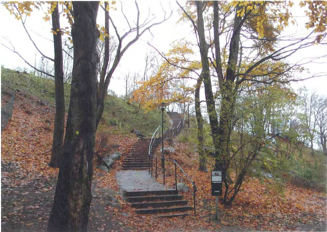
Belysning från Fox Design kännetecknas av modern tidlös design av hög kvalitet.