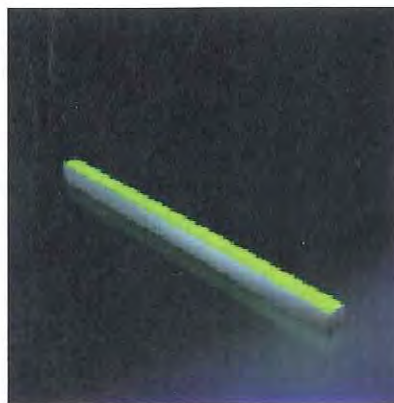
i-LèD Fusion Mono