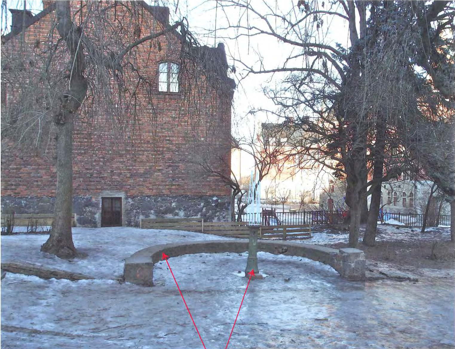
Musikinstallation i muren. Dricksvatten i brunnen återförs alt. gör ett fontän av brunnen.