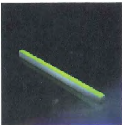
i-LèD Fusion RGB