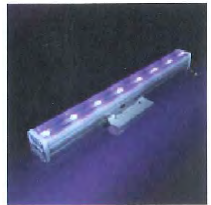
i-LèD Starline RGB