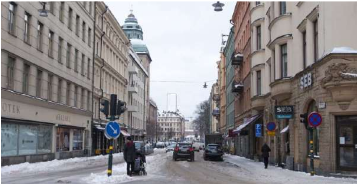
Den svagt inritade stående rektangeln i bildens mitt illustrerar nybyggnaden sedd från Hantverkargatan /Scheelegatan