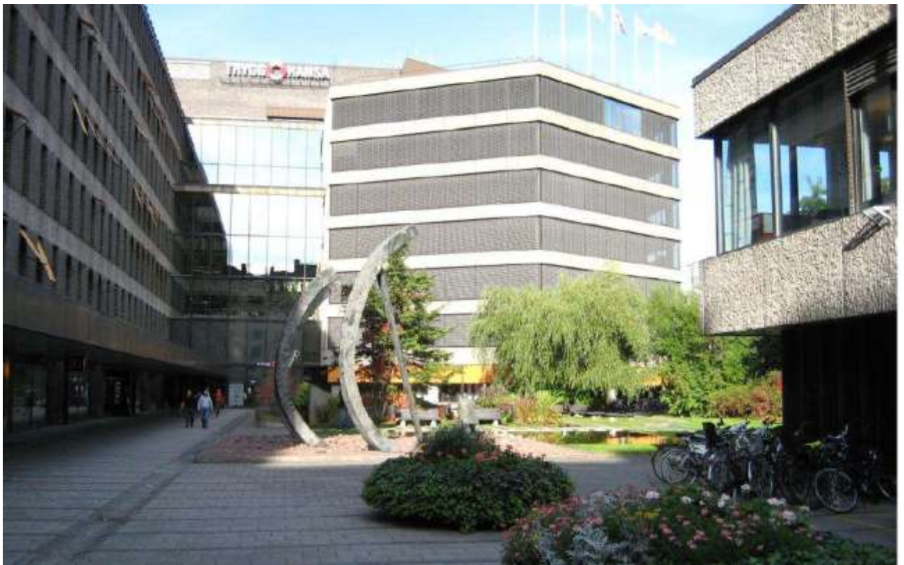
Gården med konst, damm och grönska. Till höger syns paviljongen.