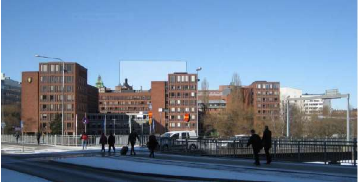
Volymstudie från Kungsbron. Nybyggnaden som en rektangulär skiva bakom Tekniska nämndhuset