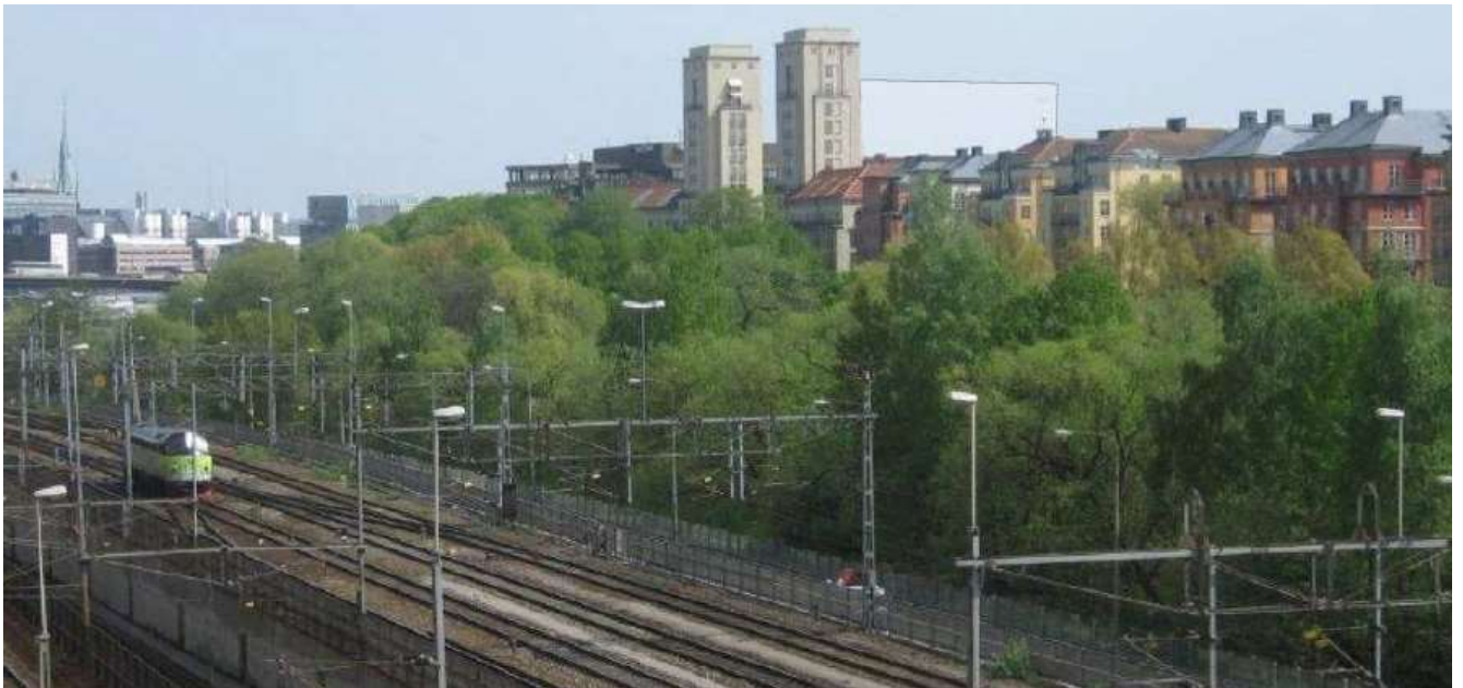
Volymstudie från nordväst. Fotomontage.