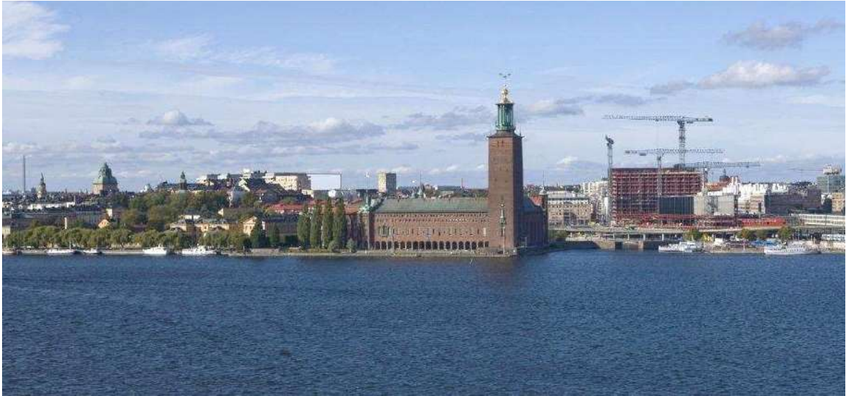
Fotomontage. Den vita rektangeln invid Kungsklippan illustrerar den föreslagna nybyggnaden.