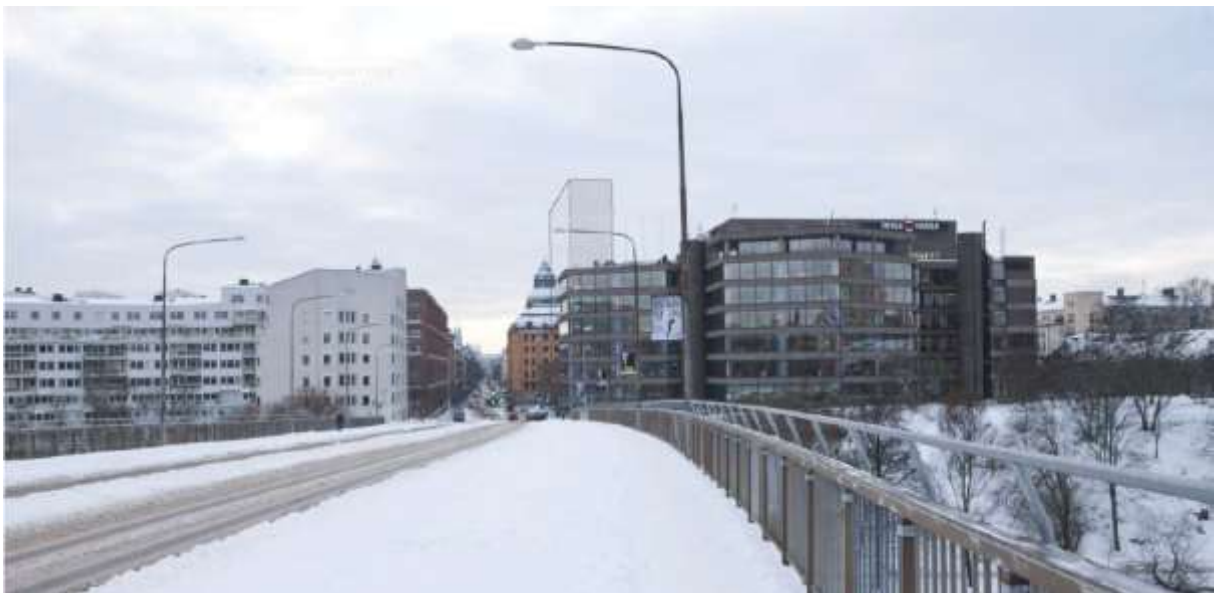
Fotomontage. Vy från Barnhusbron. Nybyggnaden skymmer delvis Rådhusets torn i denna vinkel.