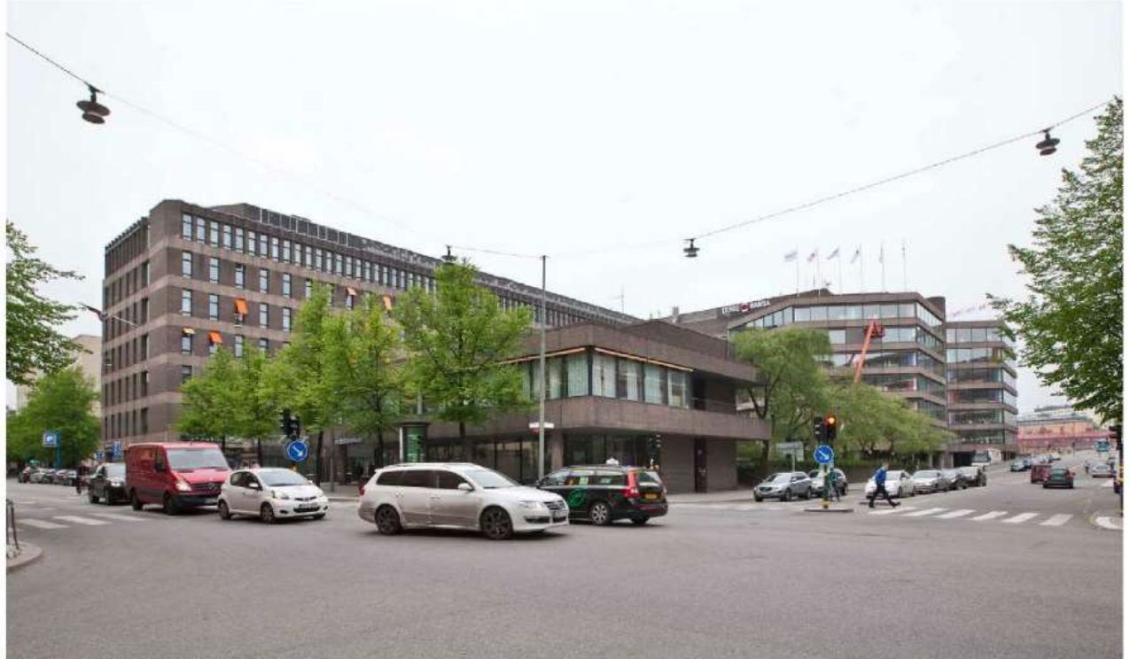
Utsikt från korsningen Scheelegatan/Fleminggatan

dokument - Lena Nordenblow, Stadsbyggnadskontoret Stockholm, 2013-06-20, Dnr: 2009-04274