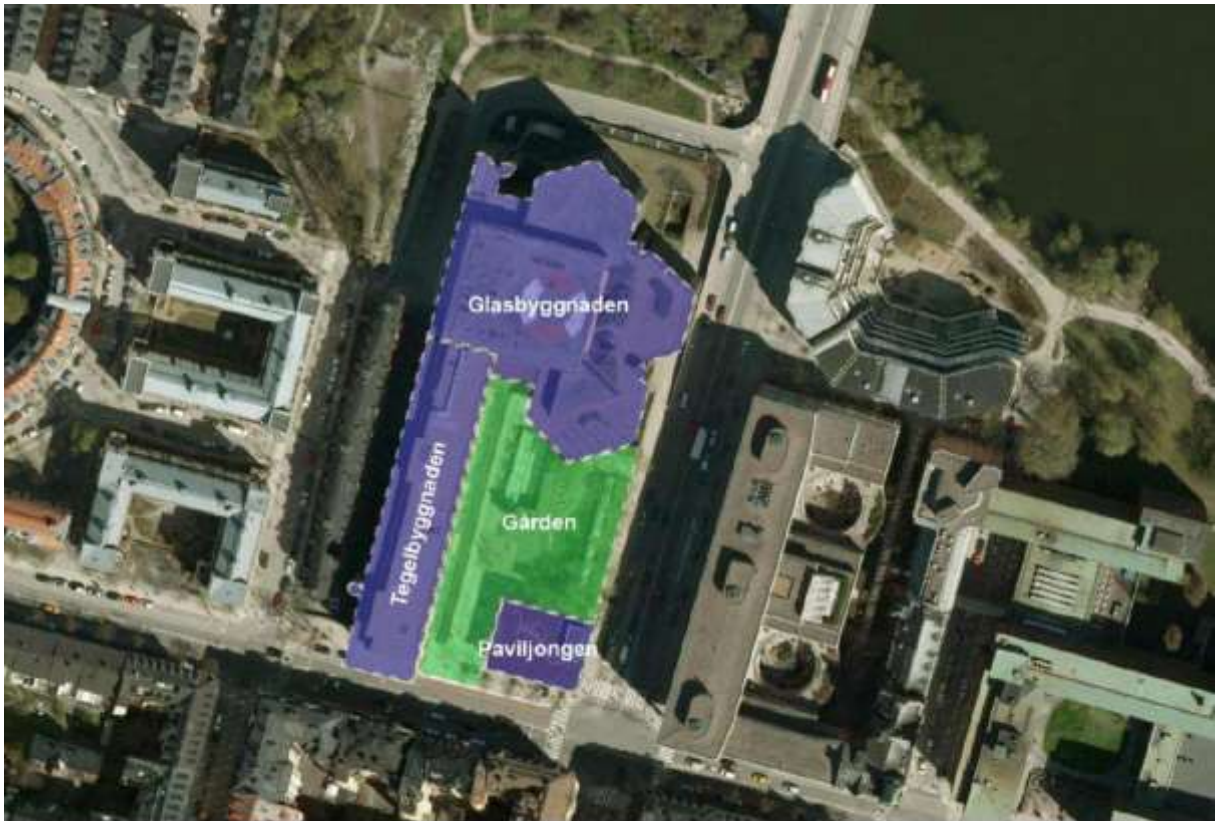
Ortofoto där de olika delarna av anläggningen redovisas