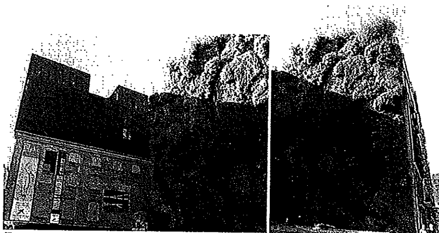
Ett exempel på en vertikal park från Madrid

Vad är en "Vertikal park"? Ja det är precis vad orden säger, en park på höjden, t ex utmed en husgavel. I Paris har tekniken med att anlägga trädgårdsanläggningar utmed husfasader utvecklats och blivit ett kärt återkommande inslag i annars gråa och kala miljöer. Nya Afrikanska museét och Cartiers huvudkontor är två sådana exempel. Ett annat mer fullskaligt utförande av en vertikal park finns i Madrid där en sådan anlagts framför det rostfärgade kulturhuset utmed en hel fasad. På väggen växer perenner såsom Rododendron, Cypresser, gran och andra vackra växter. Platsen har på detta sätt blivit en grön lunga mitt i Madrids city på en annars liten karg tomt.