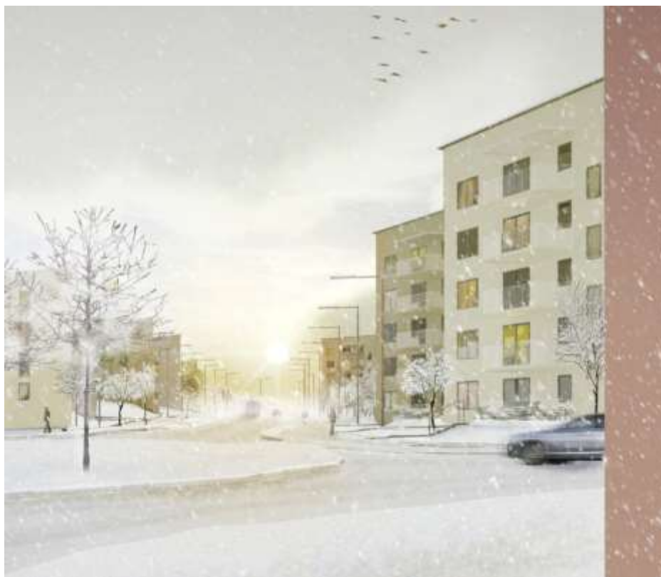
Familjebostäders hus, illustration Joliark

Utbyggnaden av projektet behöver samordnas tidsmässigt med de omfattande gatuombyggnaderna och flytten av förskolan.