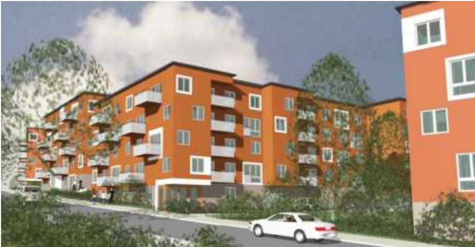
JM:s hus, illustration ÅWL