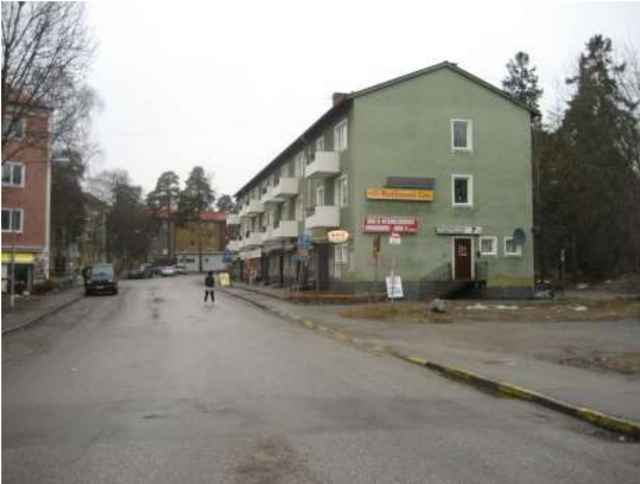
Centrumhus vid Postiljonsvägen