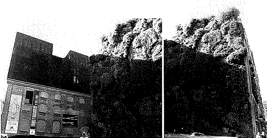
Ett exempel på en vertikal park från Madrid

Vad är en "Vertikal park"? Ja det är precis vad orden säger, en park på höjden, t ex utmed en husgavel. I Paris har tekniken med att anlägga trädgårdsanläggningar utmed husfasader utvecklats och blivit ett kärt återkommande inslag i annars gråa och kala miljöer. Nya Afrikanska museét och Cartiers huvudkontor är två sådana exempel. Ett annat mer fullskaligt utförande av en vertikal park finns i Madrid där en sådan anlagts framför det rostfärgade kulturhuset utmed en hel fasad. På väggen växer perenner såsom Rododendron, Cypresser, gran och andra vackra växter. Platsen har på detta sätt blivit en grön lunga mitt i Madrids city på en annars liten karg tomt.