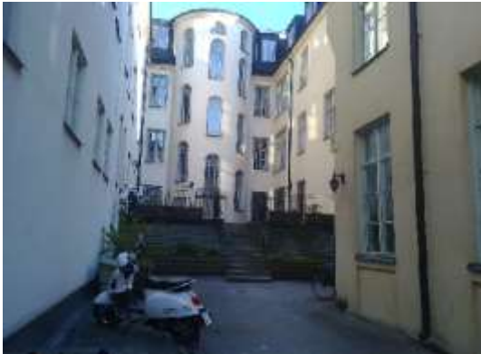
”Klara gårdar”, Kv Lammet idag