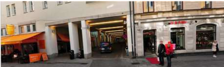
”Klarapassagen”, Korgmakargränd idag

Från Klarapassagen vandrar besökaren fritt mellan kvarteren via de portar som idag hålls låsta. Genom att öppna de bakomliggande gårdarna och förbinda dem med omkringliggande gator Bryggargatan och gamla brogatan skapas ett lugnt smultronställe mitt i city, där restauranger, lekplatser, ateljéer, pubar, caféer och andra upplevelser kan rymmas som skapar ett innerstadsrum för alla Stockholmare.