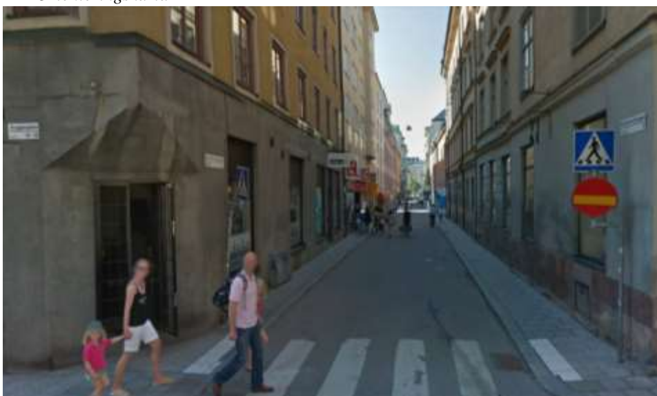
Klara Norra Kyrkogata, en typisk gata för området

Många av fasaderna i området är slutna och relativt ointressanta för fotgängare. Området skulle kunna gynnas av fler utåtriktade verksamheter för att locka fler från de omgivande större gatorna. En förutsättning för den föreslagna förändringen är att det finns en vilja bland de berörda verksamhetsutövarna inom kvarteret att utveckla