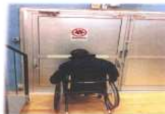
Tvåttor utgångspunkter i skidstadens