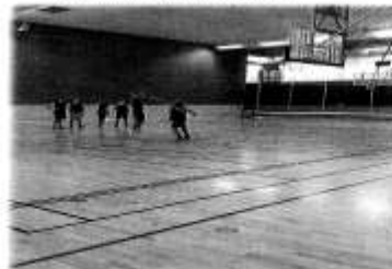
I skidstadens speglades det hälsat