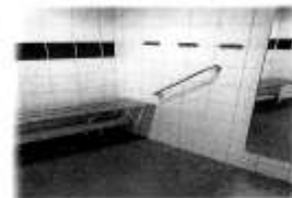
Duschutrymmet var tillgripet med sin skrivna, inga ledstänger, och duschhandtag och reglage var tillgripet.

Vi tilldelar en enda handling, tycks det vara bra att se, så var även de andra vi har.