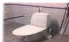
Enligt bestämt för vissa tillgångarna med hjälp