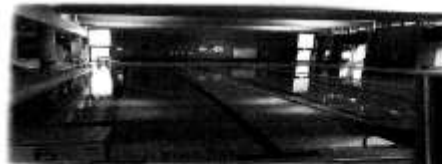
En av bassängerna

En av anläggningarna i kommunens kommun har ett utmärkt tillgängligt bassäng. Detta till följd av att anläggningen har ett bra tillgängligt bassäng och är tillgängligt för alla. Detta till följd av att anläggningen har ett bra tillgängligt bassäng och är tillgängligt för alla. Detta till följd av att anläggningen har ett bra tillgängligt bassäng och är tillgängligt för alla.