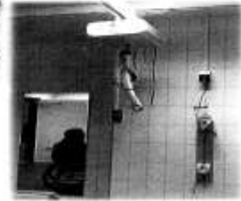
Bud- & duschutrymmet i anläggningen.