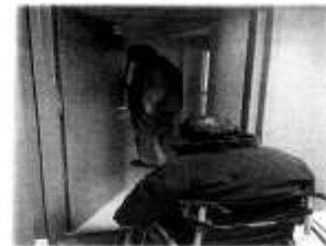
Örsmittat smittor dörrar verkade troas delvis Smygans som ständigt vilket som hjälper Hjälpslösheten