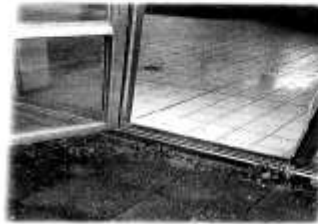
Nöddörrgången från bassängen