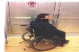
De två tiller ser över ut om man lämnar utgå gångs lämnar eller att ha person utgångspunkter