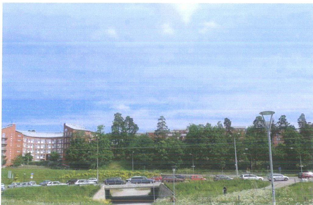
Studentområdet Lappkärrsberget, kvarteret Filosofen, mot norr. Foto juni 2010, Stockholms stadsmuseum.