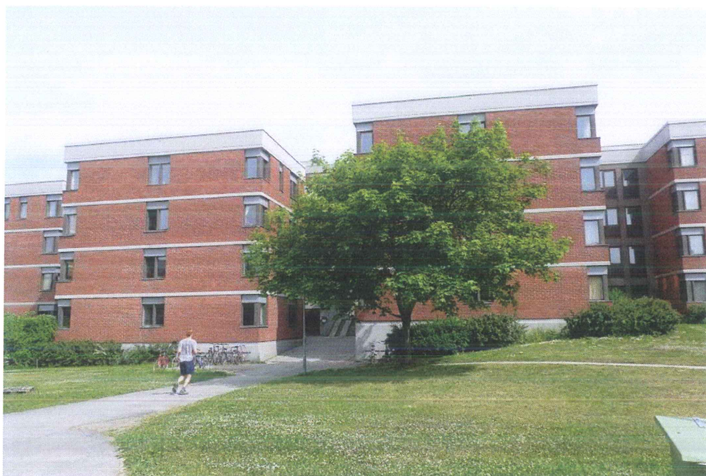
Lamellhusen är i fyra våningar och grupperar sig tätt i området. Foto juni 2010, Stockholms stadsmuseum.