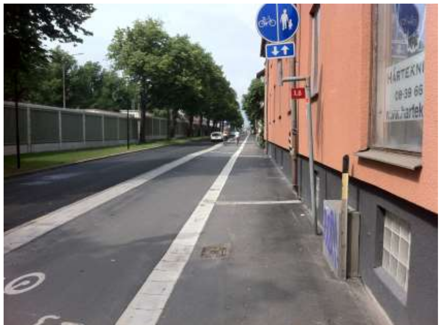
Bild 3: Nynäsvägens lokalkörbana efter ombyggnationen med cykelbanor samt bullerplank.

Projektet med cykelbanorna börjar bli färdigställt och nedan visas en bild på resultatet.