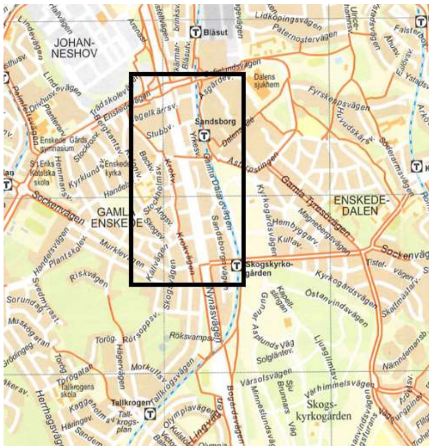
Bild 1: Utsnitt ur cykelkartan (röda linjen illustrerar cykelstråk)

Nynäsvägens lokalkörbanor är enkelriktade och då cyklandet sker i blandtrafik innebär detta att även cykellösningen är enkelriktad, vilket leder till besvärliga och tidskrävande omvägar för cykeltrafiken.