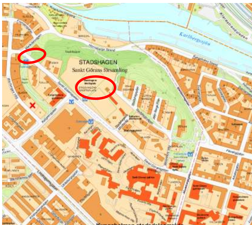
Stadshagen – gjorda markanvisningar

Utbildningsförvaltningen önskar en skola för ca 500 barn i området. Möjligt läge är invid de nya fotbollsplanerna på Stadshagens IP. Skolan bör vara klar i samband med att de nya bostäderna invid idrottsplatsen är klar. Utbildningsförvaltningen återkommer under 2014 med inriktningsbeslut för en skola.