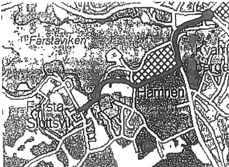
Bild ovan: Motionärens förslag till ny dragning av Chamottevägen.

Jan-O. Landqvist (S) har i en motion föreslagit att kommunfullmäktige ska ge samhällsplaneringsnämnden i uppdrag att låta förlänga Chamottevägen västerut. Motionen föreslår att Chamottevägen ska gå rakt över båtuppläggningsplatsen (även kallat Sågplan eller Boplatsen) och ansluta till nuvarande Odelbergsväg.