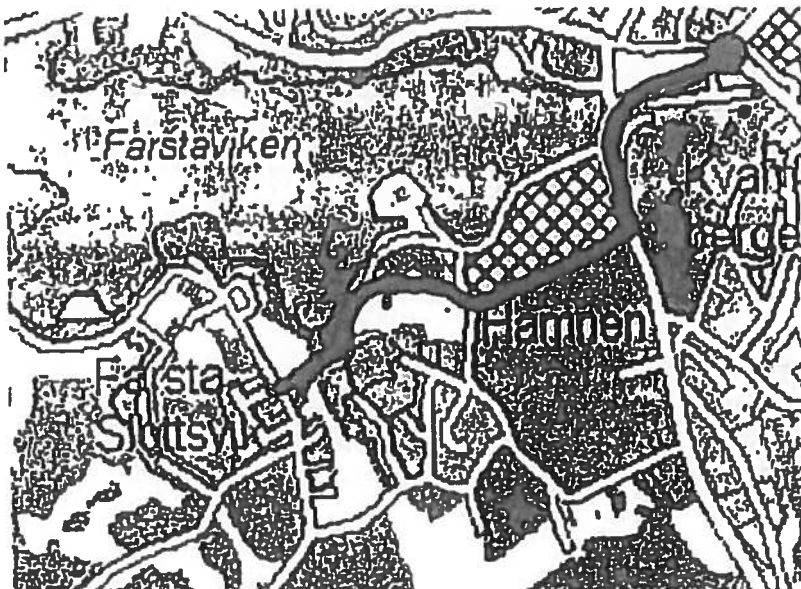
Bild ovan: Motionärens förslag till ny dragning av Chamottevägen.

Jan-O. Landqvist (S) har i en motion föreslagit att kommunfullmäktige ska ge samhällsplaneringsnämnden i uppdrag att låta förlänga Chamottevägen västerut. Motionen föreslår att Chamottevägen ska gå rakt över båtuppläggningsplatsen (även kallat Sågplan eller Boplatsen) och ansluta till nuvarande Odelbergsväg.