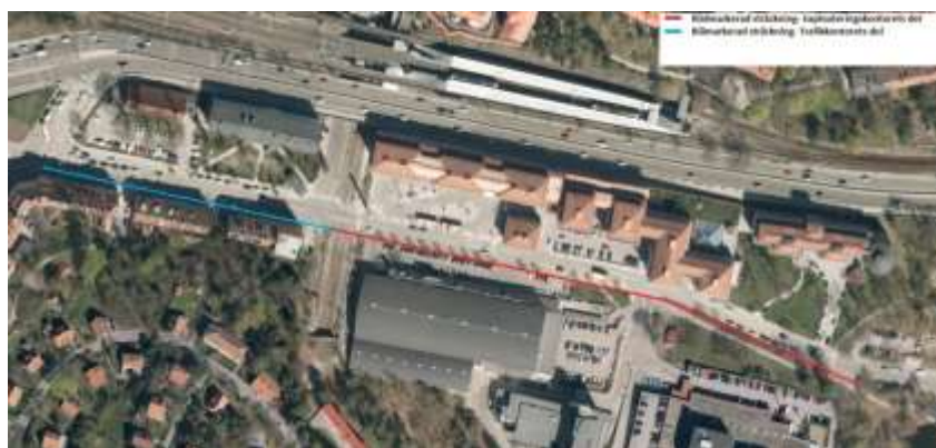
Bild 1. Utbyggnadsområde, blå sträckning illustrerar trafikkontorets del och röd sträckning exploateringskontorets.

I samband med tvärbanans utbyggnad och flera stora exploateringar kring Gustavslundsvägen har exploateringskontoret beslutat att bygga om Gustavslundsvägen. Gustavslundsvägen är den enda tillfarten till Alviks torg, Tranebergs strand och Alviks strand och trafikeras av cirka 10000 fordon per dygn. Gaturummet är idag oordnat och kontakten med omgivande stadsdelar är dålig. En ombyggnad behövs för att klara den nya trafiksituationen med tillkommande bebyggelse och ökad turtäthet på tvärbanan.