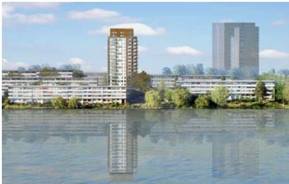
Illustration av det nya höghuset vid Strandliden inlagd i foto från vattnet. Bilden visar hur den nya byggnaden är omgiven av befintlig bebyggelse. Lindberg och Stenberg

ned eller omarbetat till en utformning som mer liknar omgivande bostadshus. Två protestlistor med ca 70 underskrifter har också lämnats.