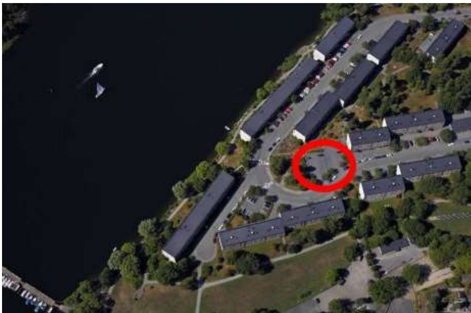
Flygfoto som visar platsen för den nya byggnaden.

Området har ett attraktivt läge nära tunnelbanan och Mälaren. Det är stor nivåskillnad ner till Mälaren och den strandpromenad som finns mellan befintlig bebyggelse och vattenlinjen.