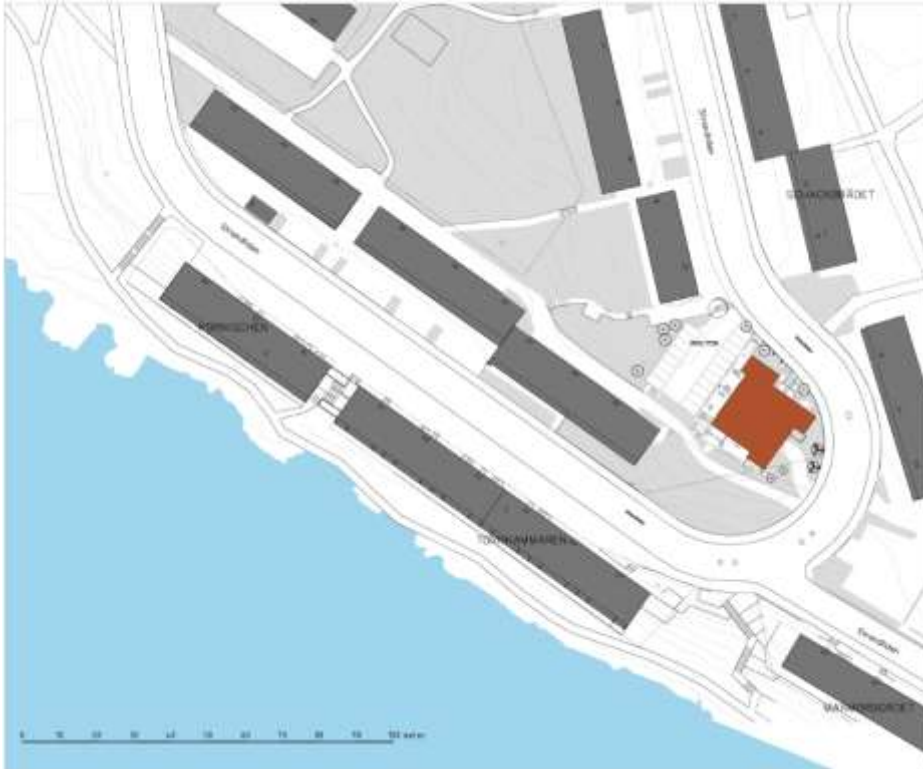
Illustration av placeringen av det föreslagna punkthuset samt parkeringsgaraget som även har p-platser på taket.

Den berörda delen av fastigheten Grimsta 1:2 utgörs av parkmark och består av en slänt med en del uppvuxna träd. Träden i södra delen ska bevaras i möjligaste mån, men två av de äldre tallarna kommer troligen inte att kunna behållas. Stadsbyggnadskontorets bedömning är att det inte innebär någon väsentlig skada för områdets naturvärden. Öster om bebyggelsen finns ett parkområde och i söder ett parkstråk utmed Mälaren som ger goda förutsättningar för promenader och friluftsliv.