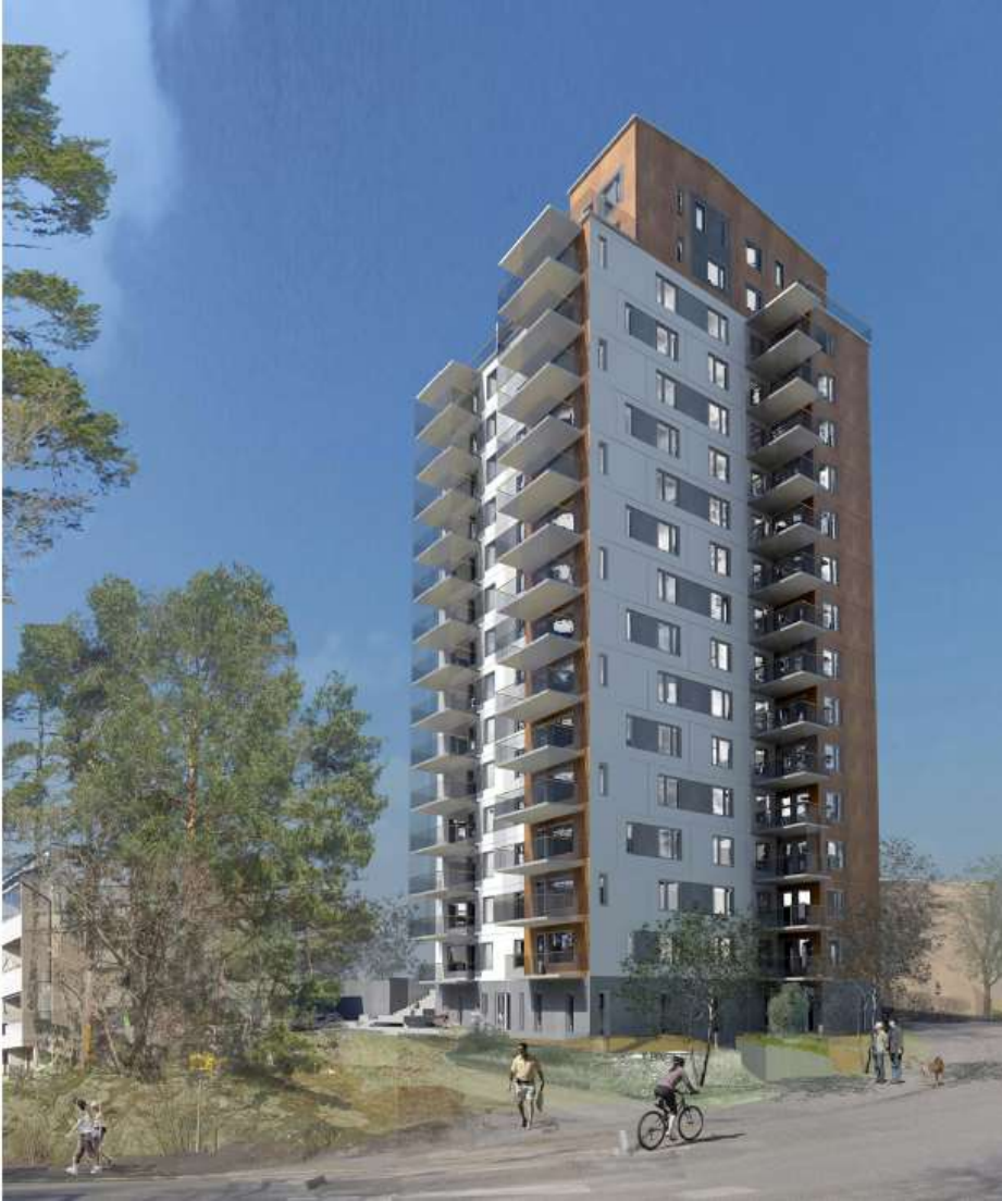
Illustration från Strandlidens kurva sydost om planområdet. Lindberg och Stenberg

Hässelby-Vällingby stadsdelsnämnd är i huvudsak positiv till det reviderade förslaget som de anser innebär en förbättring beträffande påverkan på solbelysning för omgivande bebyggelse.