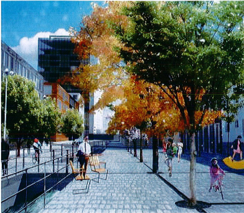
Vy söder ut på den blå gatan med planerat höghus i bakgrunden.