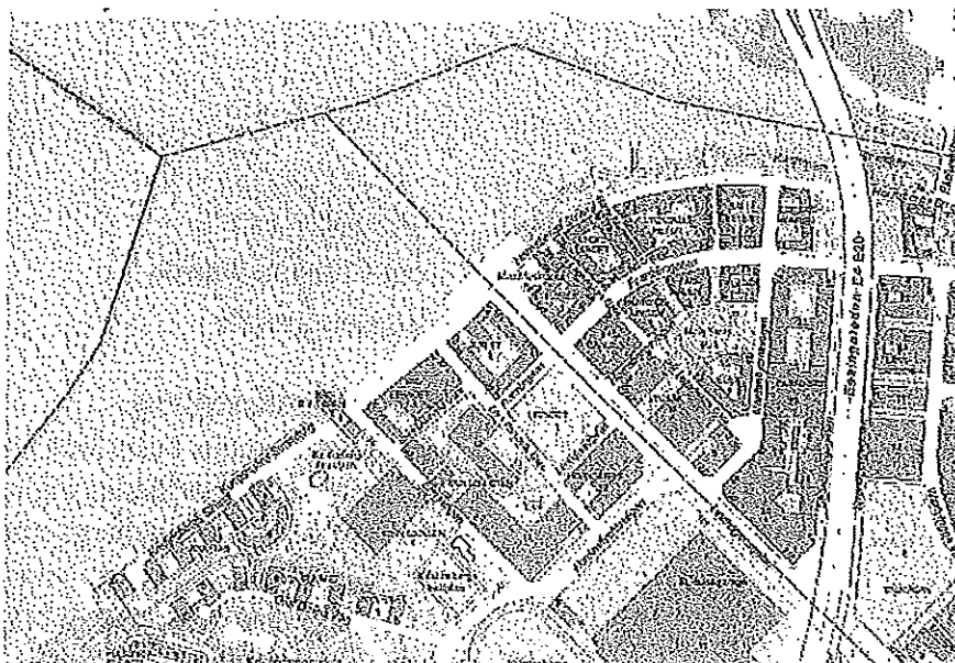
Karta över aktuellt område

Vid stadsdelsnämndens möte 25 augusti 2011 beslutades också att överlämna förslag om att anlägga en nedsänkt sjövättbassäng vid Hornsbergs Strand till exploateringsnämnden för vidare utredning.