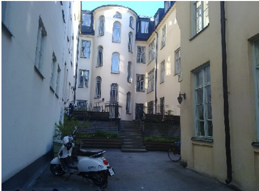
”Klara gårdar”, Kv Lammet idag