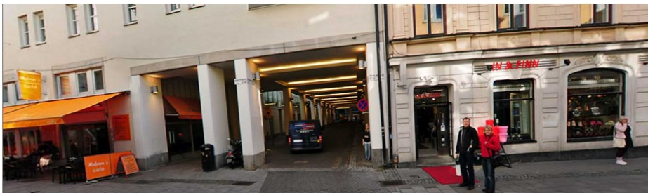
”Klarapassagen”, Korgmakargränd idag

Från Klarapassagen vandrar besökaren fritt mellan kvarteren via de portar som idag hålls låsta. Genom att öppna de bakomliggande gårdarna och förbinda dem med omkringliggande gator Bryggargatan och gamla brogatan skapas ett lugnt smultronställe mitt i city, där restauranger, lekplatser, ateljéer, pubar, caféer och andra upplevelser kan rymmas som skapar ett innerstadsrum för alla Stockholmare.