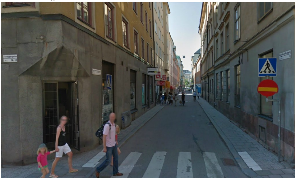
Klarabergsgatan, en typisk gata för området

Många av fasaderna i området är slutna och relativt ointressanta för fotgängare. Området skulle kunna gynnas av fler utåtriktade verksamheter för att locka fler från de omgivande större gatorna. En förutsättning för den föreslagna förändringen är att det finns en vilja bland de berörda verksamhetsutövarna inom kvarteret att utveckla