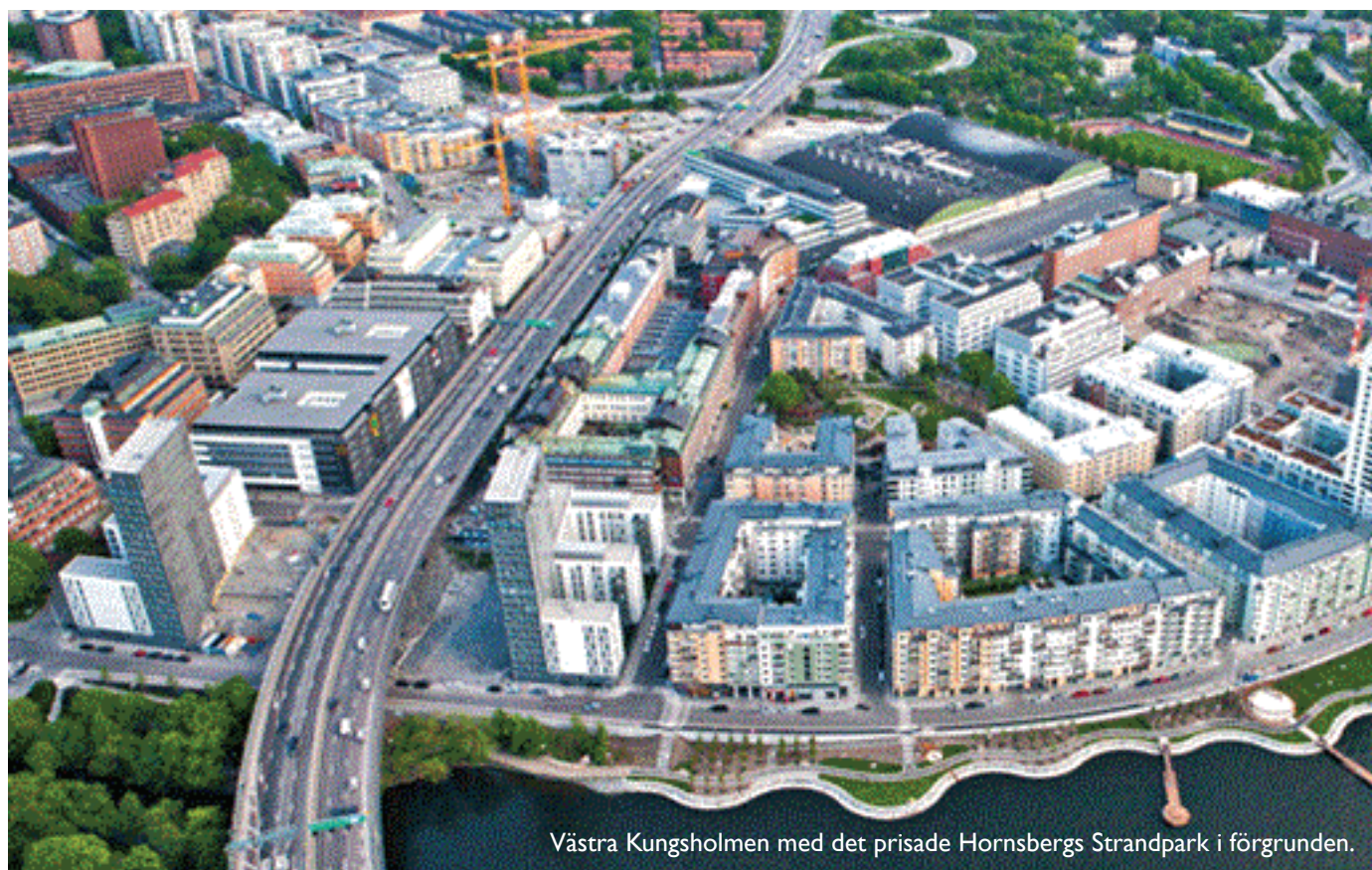
Västra Kungsholmen med det prisade Hornsbergs Strandpark i förgrunden.