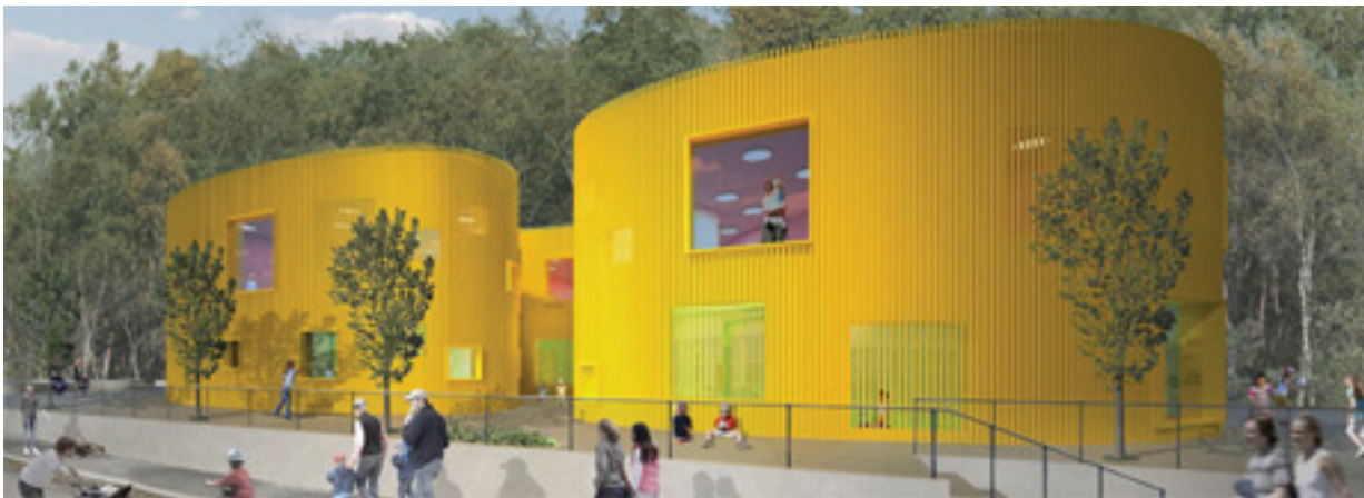
Förskolan Paletten vid Telefonplan

År 2004 antog stadsbyggnadsnämnden ett detaljplane-program för utbyggnad av Telefonplansområdet som gav förutsättningar för området att kunna expandera med ca 2 000 nya bostäder och ca 70 000 kvm ny lokalyta.