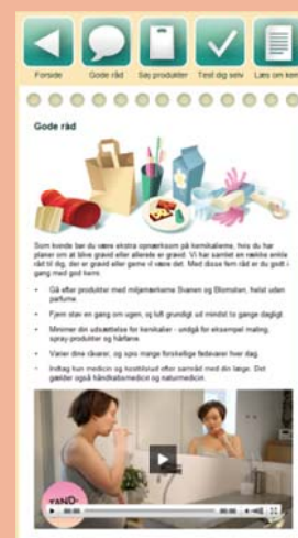
Mobilapp för blivande föräldrar från Danmarks miljöministerium och miljöstyrelse

Två goda exempel på information från nationella myndigheter till småbarnsföräldrar m fl.