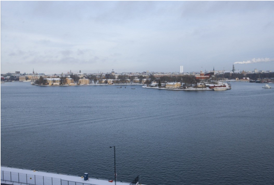
Bild. Den nya bostadsbyggnaden sedd från Fjällgatan – Stadsbyggnadskontoret