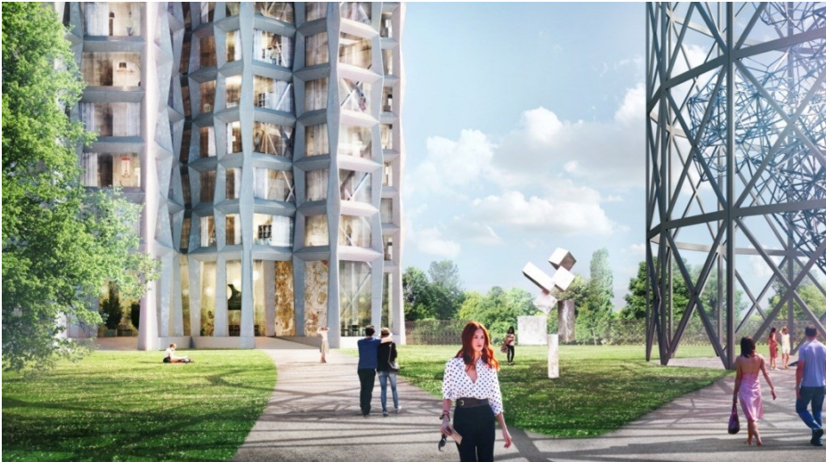
Bild. Den nya bostadsbyggnaden tillsammans med konstverk i Gasklocka 3 och skulpturpark – Herzog & de Meuron