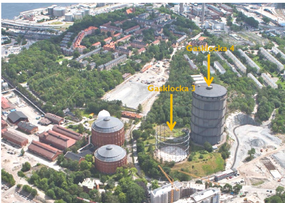
Bild flygfoto 2011. Planområdet med kompositionen av de befintliga gasklockorna inom planområdet.

Planområdet utgör del av stadsutvecklingsområdet Norra Djurgårdsstaden. Detaljplanen syftar till att möjliggöra bebyggelse för i huvudsak bostadsändamål på mark som tidigare använts för industriändamål. Tillkommande bebyggelse är tänkt att ersätta den befintliga Gasklocka 4 som därmed rivs. Gasklocka 3 som också ingår i planområdet föreslås till största del bevaras och användas för kulturellt ändamål. Exploateringsnämnden har anvisat mark för bostäder och lokaler inom området till en byggherre, Oscar Properties.