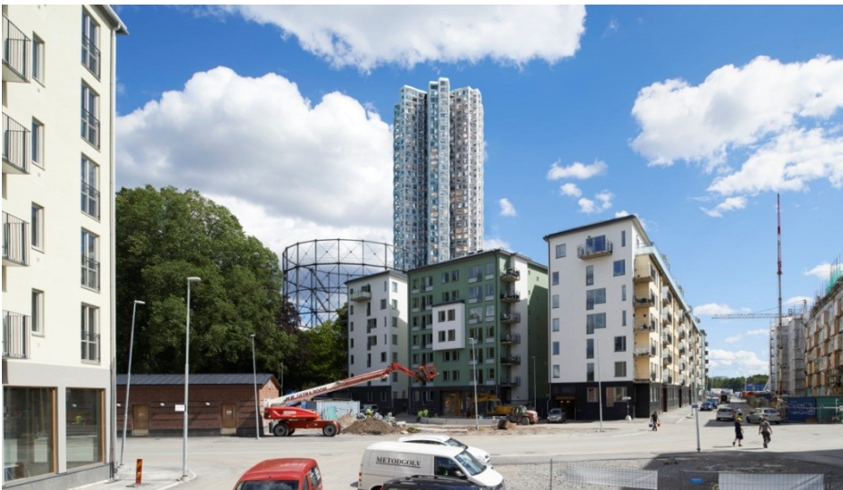
Bild. Den nya bostadsbyggnaden sedd från väst med de nybyggda kvarteren i Norra 1 i förgrunden – Herzog & de Meuron