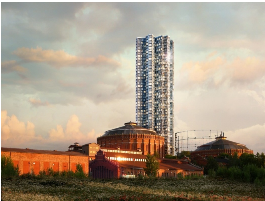
Bild. Den nya bostadsbyggnaden sedd från nordost – Herzog & de Meuron

De båda objekten kommer tillsammans att vara fokuspunkt för en mängd urbana och publika funktioner som stärker omvandlingen av den tidigare industriella platsen till att bli en del av den befintliga staden.