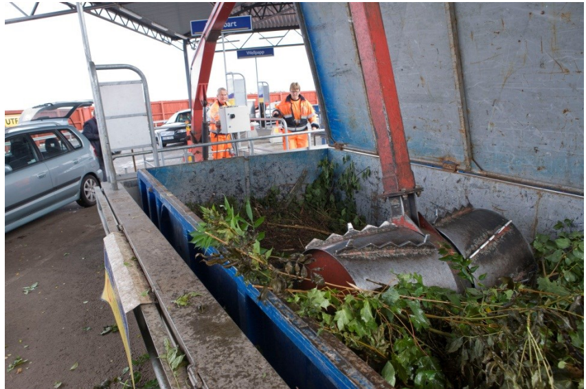
Nuvarande lösning för ris

kapaciteten för Bromma återvinningscentral är att hantera trädgårdsavfallet i ett eget flöde. Om det går att ordna så att materialet lastades av i fickor eller liknande skulle hanteringen förenklas ytterligare för kunderna.