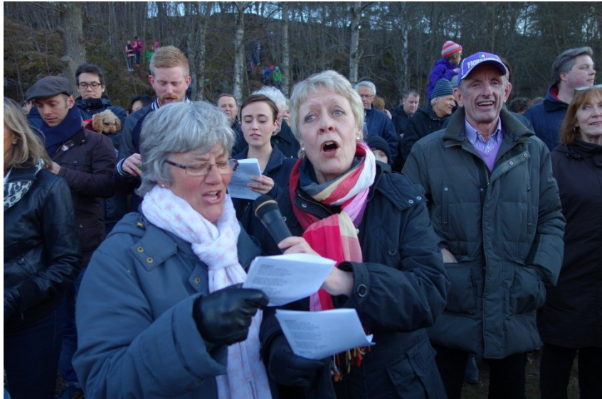
Ta tillvara på lokalsamhället! Exempelvis samarbetar SDF med Värtans IK (bild från Valborgsfirandet 2013).

medborgarkontakt har också kommunikationen av större och mer komplexa frågor underlättats.