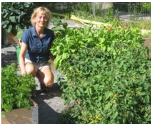
Stadsodlingen i Norra 1 blev en framgång till glädje för såväl boende som besökare. Satsningen fortsätter 2014.

Till sommaren 2014 ska park anläggas på platsen för den tillfälliga urbana odlingen i Norra 1. Stadsdelsförvaltningen kommer att ordna tillfällig urban odling på nya platser inför den nya odlingsäsongen. Målsättningen är att möjliggöra urban odling för ännu fler i Hjorthagen/NDS.