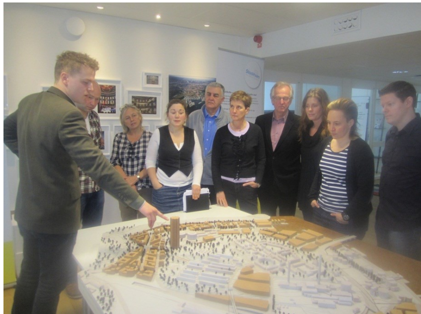
Det är viktigt att involvera boende och andra aktörer i stadsutvecklingen.

Våren 2012 inleddes ett arbete med att uppdatera miljö- och hållbarhetsprogrammet utifrån de erfarenheter som gjorts i det operativa arbetet sedan 2010. SDF har varit en integrerad del av uppdateringen, och under våren 2014 kommer det nya hållbarhetsprogrammet redovisas i berörda nämnder.