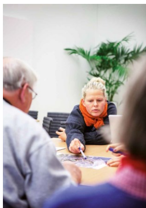
I medborgardialogen kring natur- och kulturstigen engagerades både gamla och unga.