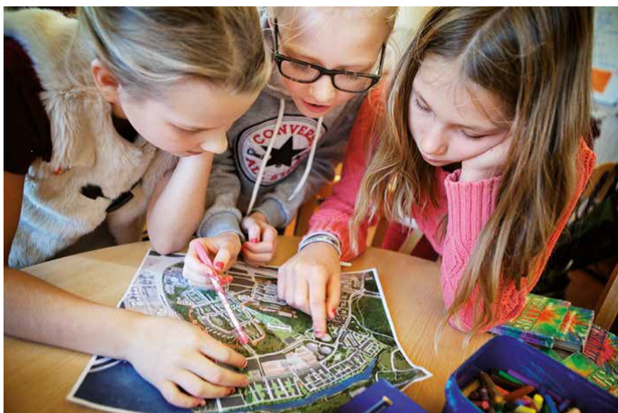
Medborgardialog. Elever från Hjorthagens skola diskuterar natur- och kulturstigen hösten 2013.

Hur involverar man medborgarna i processen? Östermalms stadsdelsförvaltning har fått ett ökat ansvar för dialog, information och kommunikation med boende. Denna rapport syftar till att dokumentera den process och arbetsmodell som förvaltningen utvecklat sedan oktober 2010. Den inkluderar slutsatser som vi hoppas kan komma till nytta även vid andra stadsutvecklingsprojekt.