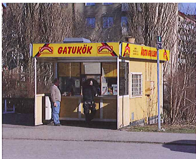
4. En vanlig kiosk på ca 10 kvadratmeter. Den här finns i Årsta.

En kiosk är en liten, fristående byggnad med försäljning av varor eller tjänster som bidrar till den allmänna nyttan och trevnaden för allmänheten. Snittstorleken på en kiosk som fått permanent bygglov i Stockholm de senaste fem åren är 14 kvadratmeter. Gatuköken, det vill säga kiosker som också har möjlighet till viss matlagning, är runt 15 kvadratmeter och några är uppåt 20 kvadratmeter.