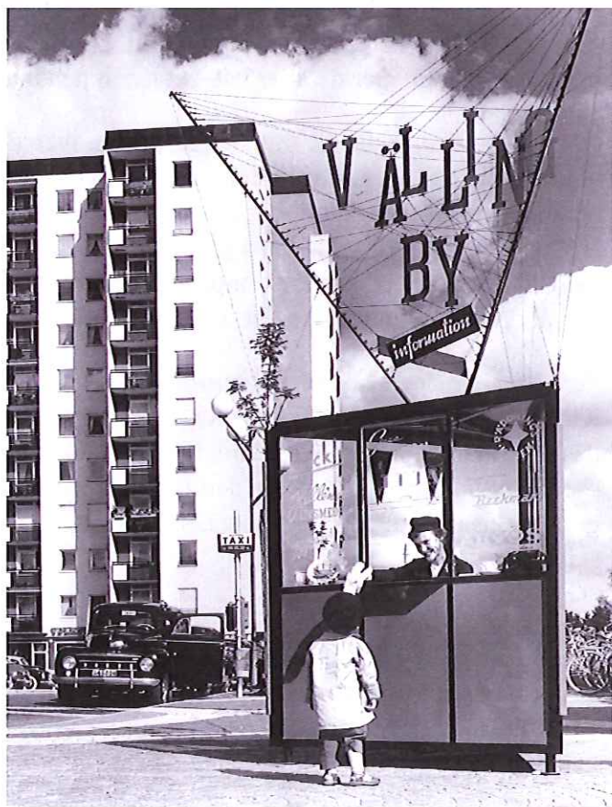
22 och 23. Ytterligare kiosker som inte finns längre men som är fina exempel på anpassning till platsen och eget formspråk.