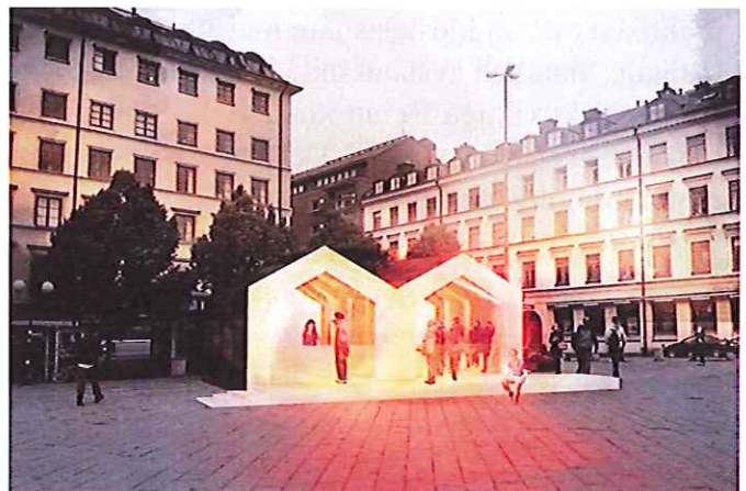
16. 2013 hade Fastighetskontoret i Stockholms stad en arkitektävling för att få fram förslag på nya typer av små, mobila byggnader i staden i staden. Syftet var att hitta nya former och varierad arkitektur för exempelvis kiosker. Tre vinnare utsågs, varav denna är en. (fotomontage).

Med innovativ arkitektur kan Stockholms identitet utvecklas och på ett modernt och medvetet sätt. En kiosk passar särskilt bra för att testa innovativa arkitektoniska lösningar eftersom den står fritt i förhållande till andra byggnader, är liten och ofta tillfällig och därför inte påverkar staden i stor skala.