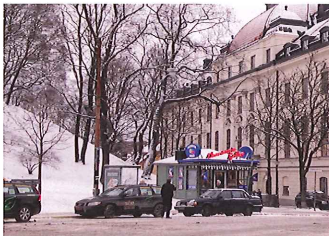
12. Denna kiosk vid Observatorielunden mot Drottninggatan har placerats så att påverkan på parken blivit så liten som möjligt.