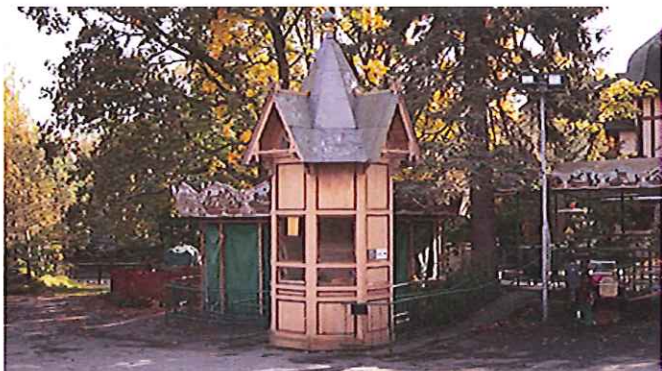
20. En kiosk från Stockholmsutställningen 1897. Det är den äldst bevarade i staden och står nu på Skansen.