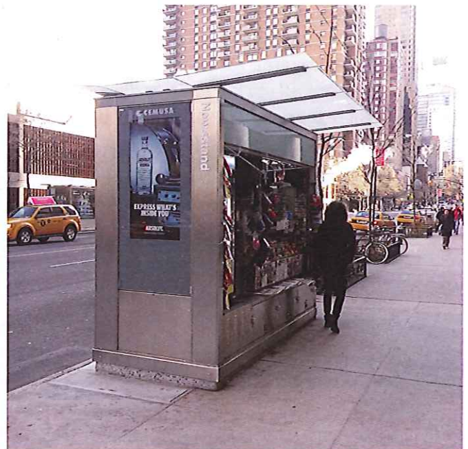
15. Den här kiosken är utformad särskilt smal för att få plats på trottoaren. Den har anpassat sättet den visar upp sina varor på utifrån varan. Reklamen är inarbetad i arkitekturen. Enkla och lättskötta material har används. Denna kiosk står i New York.