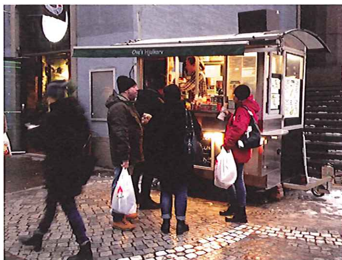
5. En serveringsvagn, eller "kiosk på hjul", räknas inte som byggnad om den är tillfälligt uppställd. Det innebär att den tas bort nattetid, eller att den vid ett enstaka tillfälle står uppställd max en månad.