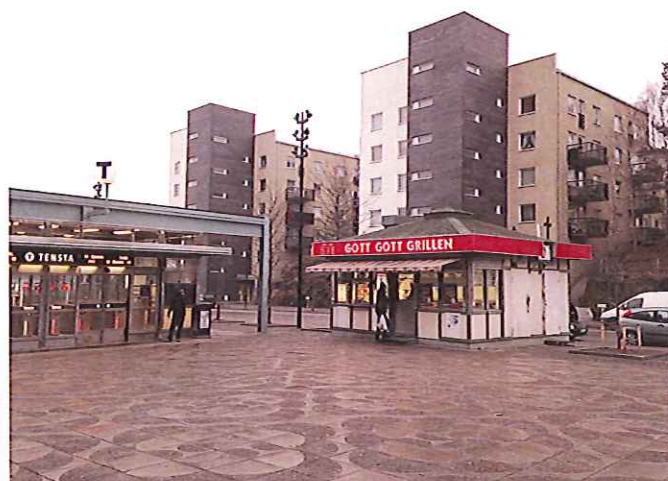
10. Detta gatukök i Tensta är ca 30 kvm och är anpassad till den storskaliga miljön vid tunnelbanan och höghusen. Detaljplanen anger att området får användas för centrumbebyggelse.