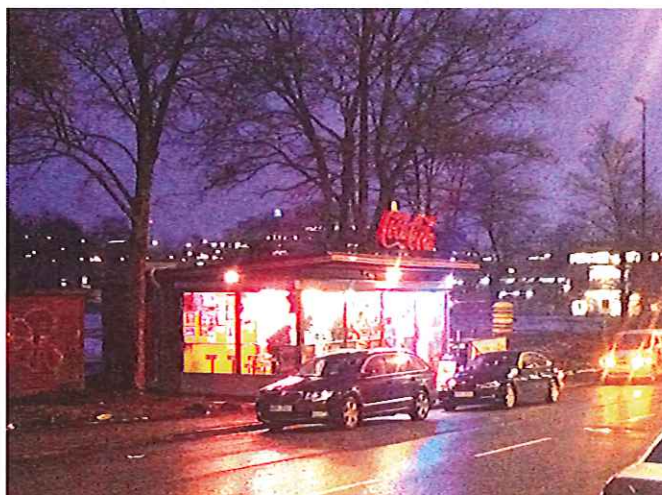
13. Den här kiosken i Västberga är 48 kvadratmeter. Den står på en plats där detaljplanen säger idrottsändamål och har därför bedömts som planenlig.

Eftersom byggnaderna runt omkring också är storskaliga och gaturummet också är stort och brett passar denna kiosk in i miljön just här.