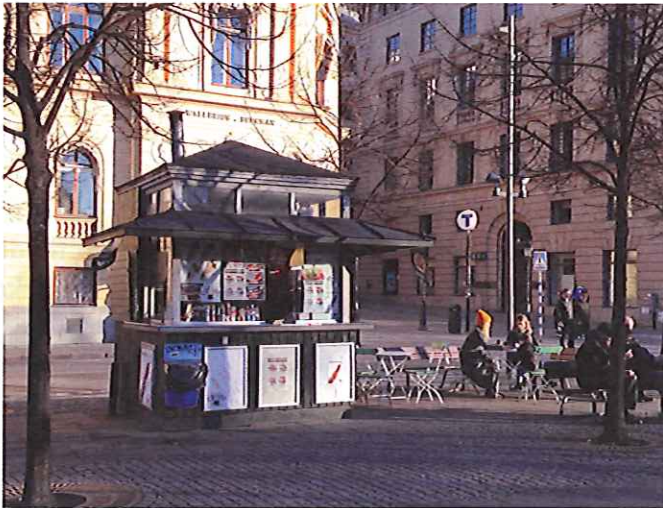
14. Den här kiosken har fått ett eget arkitektoniskt uttryck med sin högresta form och överljus. Stilfullt utformad glasskiosk som står i Kungsträdgården.

"En byggnad ska ha god färg, form och materialverkan".