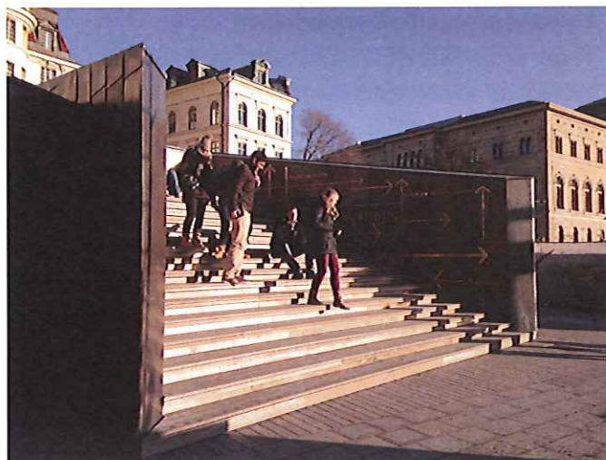
9. Denna serveringsbyggnad på Strömkajen är utformad så att vägen och taket ger soliga sittplatser för allmänheten med utsikt över vattnet. En särskild detaljplan gjordes för att möjliggöra denna byggnad och två intilliggande byggnader.

På allmän plats är det alltid viktigt att den allmänna funktionen tydligt dominerar och att platsen inte privatiseras. En restaurang som har servering och sittplatser helt eller delvis inomhus och är över 25 kvadratmeter eller större är ett exempel på när en privat verksamhet är för stor för att få bygglov när det i detaljplanen står att marken ska vara allmän plats. På väldigt stora allmänna platser, som exempelvis i strövområden, kan något större serveringsbyggnader också få bygglov om det kan ses som ”liten avvikelse från detaljplanen”.