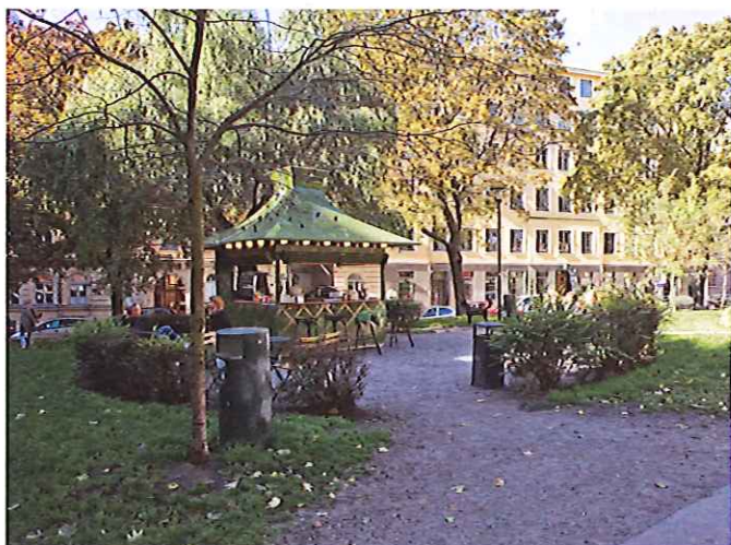
11. Denna kiosk på Mosebacke har varsamt placerats ut för att inte hindra gående eller genomblickar i parken. Med sitt gröna, toppiga tak underordnar den sig det gröna stadsrummet på ett vackert och lekfullt sätt.