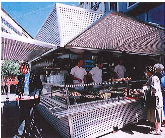
17. I stadens planering kan tillfällig arkitektur, som denna kiosk på Stureplan, inspirera till ny användning och öka kunskapen om det offentliga rummet.

Tillfällig arkitektur kan innebära experiment med tillfälliga stadsrum och parker och påverka och förändra förutsättningarna för stadslivet. Kiosker, som ofta är temporära till sin karaktär, är därför också väl lämpade för experimentell arkitektur på oväntade platser under en begränsad tid.