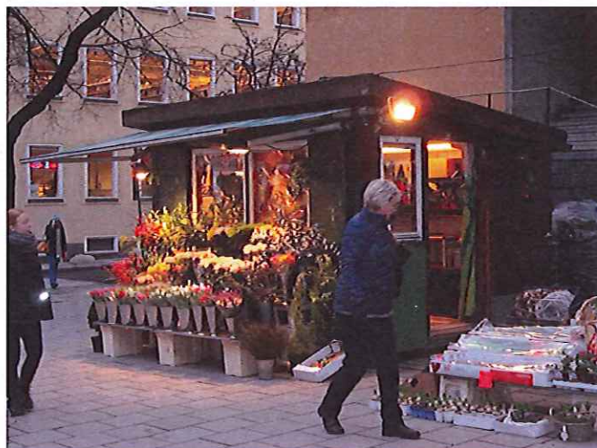
19. Blomsterkiosken på Odengatan är ett exempel på att kioskens utbud "sväller ut" utanför byggnaden. Andra exempel på samma sak är sittplatser vid glasskiosker. Sådana lösa arrangemang ingår inte i bygglovets, men kan regleras av den som äger marken.

Planerar du att hantera brandfarliga varor, exempelvis gasflaskor, behövs tillstånd från Storstockholms brandförsvaret. Längst bak i denna vägledning finns kontaktuppgifter.