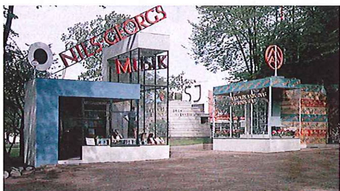
21. Kiosker på Stockholmsutställningen 1930 som banade vägen för funktionalismens arkitektur i Sverige. Inte bevarade.

Historien visar att det är mycket annat än stadsbild och efterfrågat utbud som påverkat kioskerna. Idag behöver flertalet kiosker byggas om, byggas till eller ersättas för att de inte klarar nutida krav på miljöriktig avfallshantering, ökade krav på tillgänglighet och krav på utformning av arbetsmiljöskäl. Även om en kiosk stått på en viss plats under decennier ger det inte per automatik en rättighet att bygga till och utöka hur som helst.