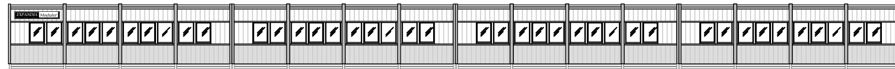
FASAD MOT VÄGEN