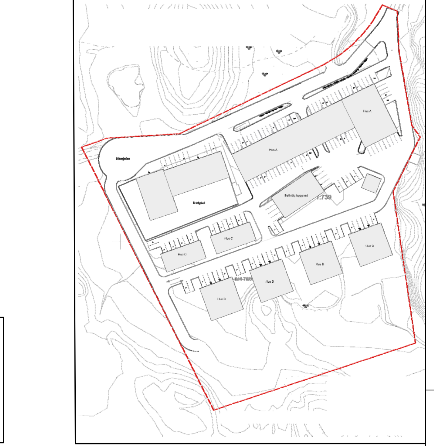
Illustrationsplan över verksamhetsfastigheten

Information om tillstånd inom vattenskyddsområdet Tillstånd enligt miljöbalken finns inom planområdet. ML 2012.3329 och ML 2013.4098. Planområdet är beläget inom vattenskyddsområde för Ingårö vattentäkt. Se vidare beslut om vattenskyddsområde med föreskrifter för Ingårö grundvattentäkt i Värmdö kommun, 2012-05-31. Byggnads- och anläggningsåtgärder inom vattenskyddsområde ska följa givna tillstånd enligt miljöbalken. Gräns mellan primärt och sekundärt vattenskyddsområde