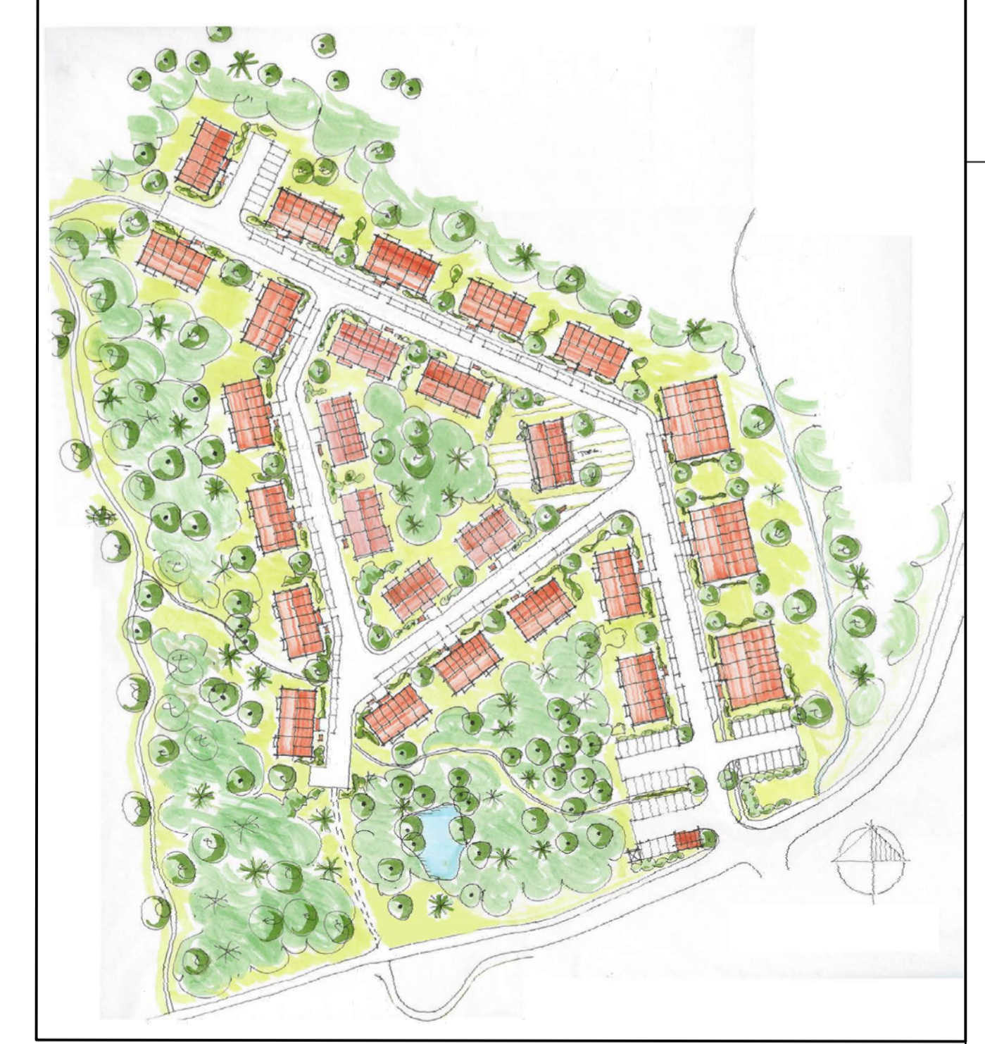
Illustrationsplan över seniorboendet

Kommunen är inte huvudman för allmän plats